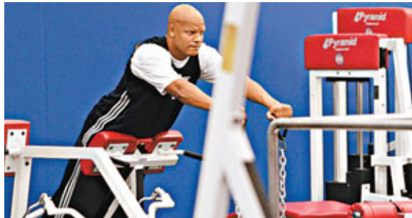
活塞爾特人隊員在健身房。

基斯保羅今夏經常和好友安東尼在一起，二人也常被傳希望可並肩作戰，據報基斯保羅的經理人更直言「蜂王」不會與黃蜂續約，希望被交換到紐約人，不過紐約人前鋒安東尼否認嘗試拉攏「蜂王」搬寶到紐約。