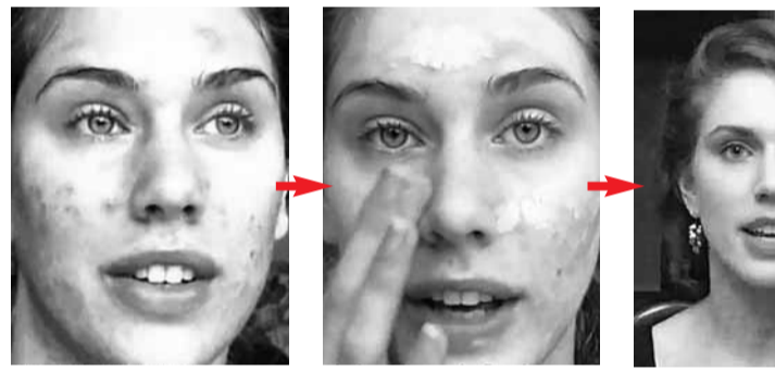
未上妝時，班克森臉上長滿「痘痘」。 塗粉底霜、撲粉等化妝步驟。 完美化妝術後的美觀容貌。 網上圖片

由法國記者陶布曼(見圖)執筆的《卡恩性事：反調查》，聲稱事發當日，卡恩洗完澡後赤裸步出浴室，赫見案中主角、酒店女工迪亞洛在房內，女方未有迴避，卡恩面對「挑逗」把持不住，與之發生性行為。作者形容，卡恩一生中「絕少放過尋歡作樂的機會」。 ■美聯社/法新法/《泰晤士報》