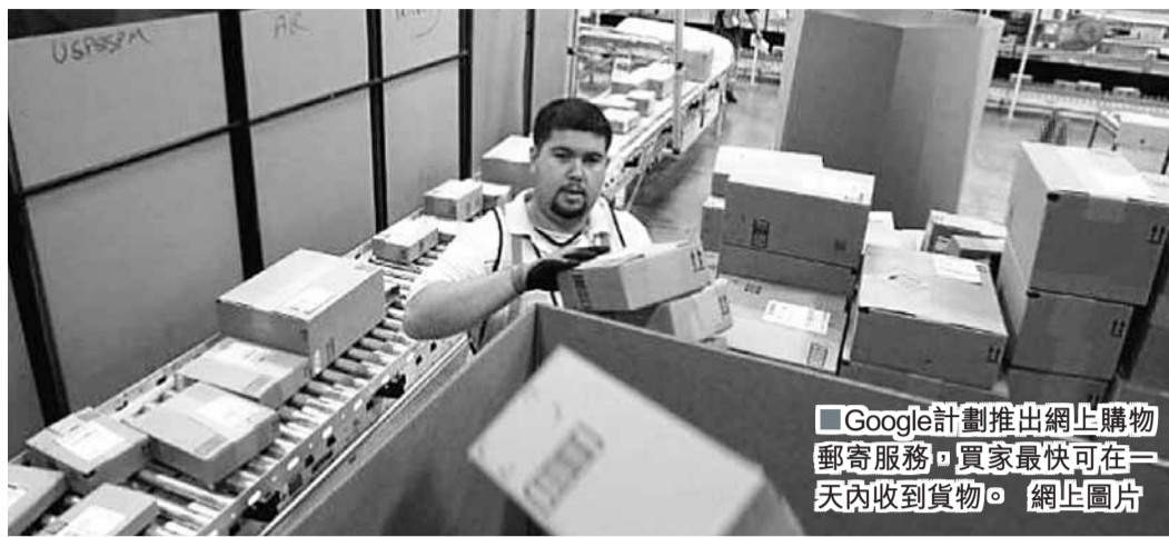
Google計劃推出網上購物郵寄服務，買家最快可在一天內收到貨物。 網上圖片

亞馬遜Prime年費79美元(約614港元)，為消費者提供免費的兩日內送貨服務。市場研究公司comScore數據顯示，在過去一年，亞馬遜的產品搜索次數是Google的3至4倍。 ■《華爾街日報》/路透社