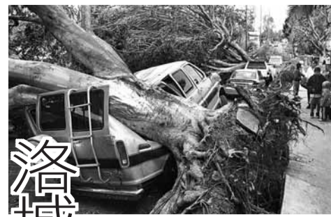
強風將洛杉磯大樹吹倒後再壓毀車輛。

孃、隆胸診所，對墮胎問題卻一問三不知，網民質疑這可能是蘋果已故創辦人喬布斯的主意。喬布斯曾感謝生母把他生下，而沒選擇墮胎。不過另有意見認為，今次「墮胎門」事件可能是蘋果與網絡服務商的商業合約所致。Siri發明者威納爾斯基表示，Siri把用戶的說話轉成文字，再挑選出關鍵字，可從不同網絡供應商取得答案。 ■《每日郵報》