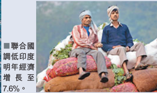
聯合國調低印度明年經濟增長至7.6%。