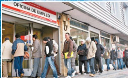
明年全球經濟前景將受制於發達國家債務風險、高失業率等危機。圖為西班牙失業者登記找工作。

但生於匈牙利的索羅斯也指出，1956年的匈牙利革命雖然改變了政治氣氛，但直到1989年才結出革命的果實。他說，你不能指望取得立即的成功，但正在發生的事情將會產生深遠的影響。■《華爾街日報》