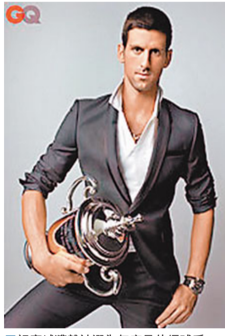
祖高域獲雜誌選為年度最佳網球手。