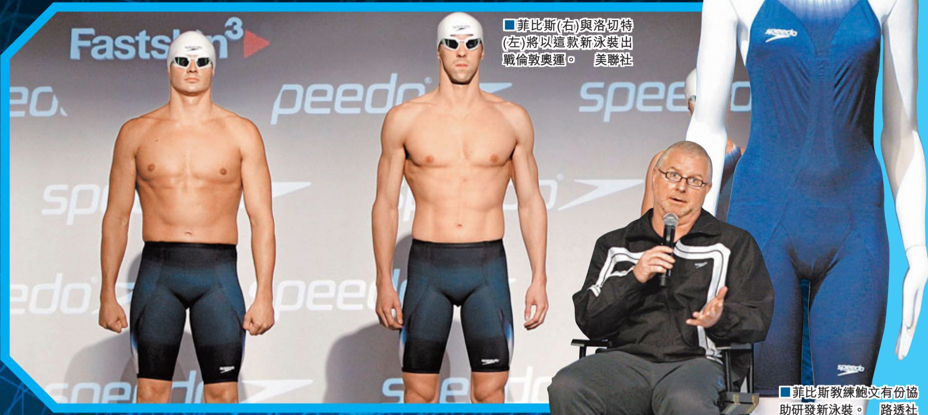
菲比斯(右)與洛切特(左)將以這新款新泳裝出戰倫敦奧運。

倫敦奧運會尚餘8個月便告揭幕，美國兩大泳星菲比斯和洛切特周三在曼哈頓率領美國隊成員展示新款奧運戰衣，二人對這件被外國媒體形容為穿後似「蜘蛛俠」和「外星人」的新戰衣均讚不絕口，洛切特更形容穿上這身泳裝後，感覺就像超人一樣，可擊敗任何對手。