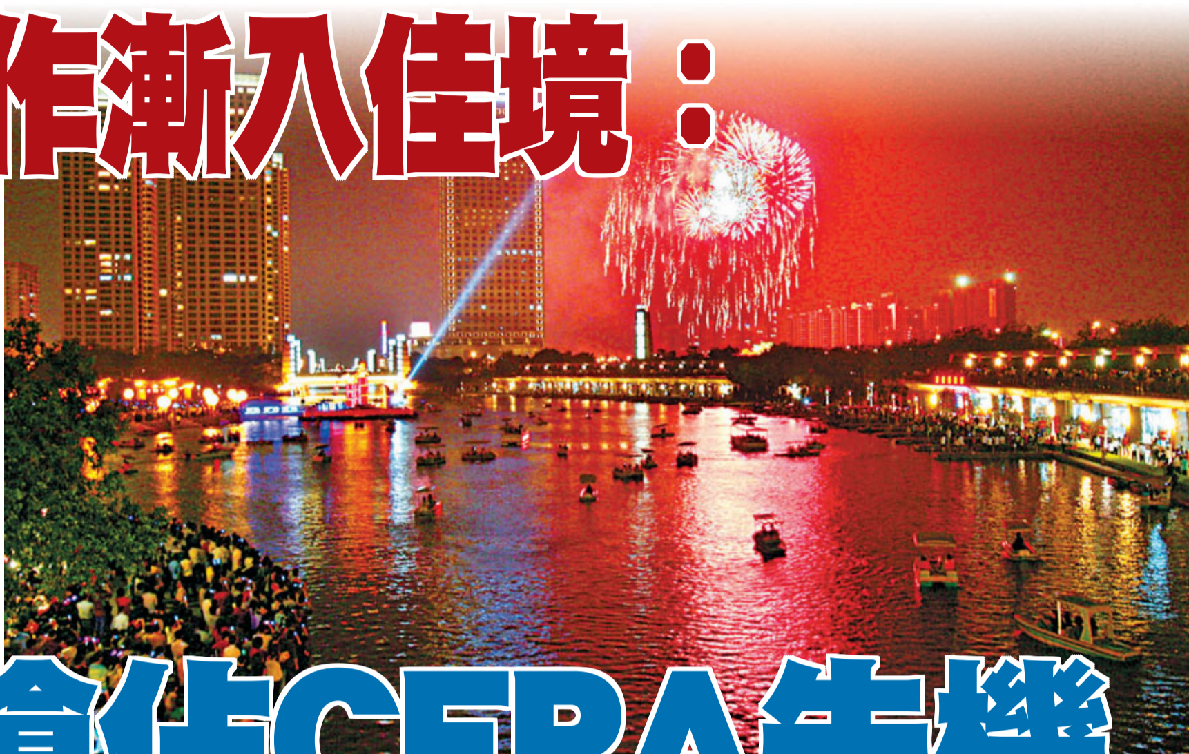
■2010年正月十五元宵節，南海桂城千燈湖上煙花盛放（佛日）。