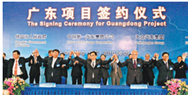
■大眾汽車落戶佛山

要制訂了全方位的產業發展配套政策。相關優惠政策包括總部經濟政策、人才優惠政策、中小企業市場開拓資金等。