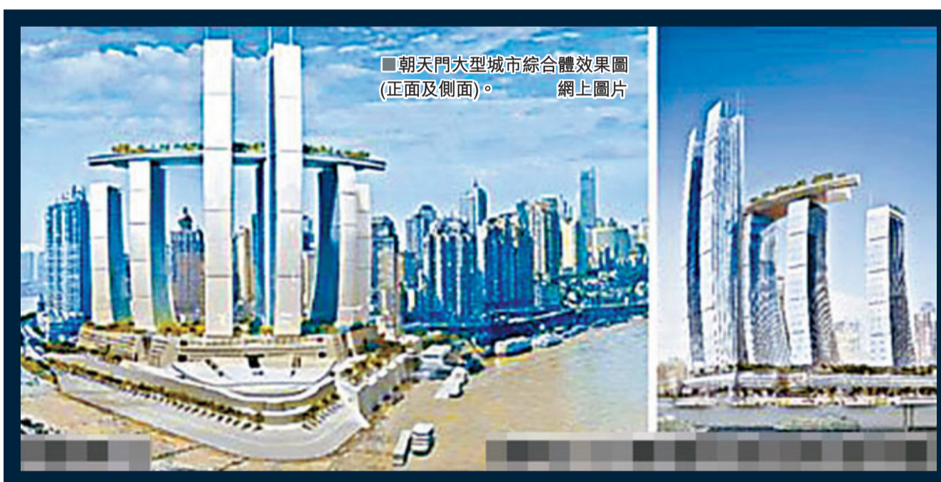
朝天門大型城市綜合體效果圖(正面及側面)。

香港文匯報訊 在內地房地產遇冷、價格下調預期增強的態勢下,11月28日,重慶市國土局向新加坡淡馬錫及其幾家公司設立的合營公司發放了土地成交確認書。據悉,這些新資企業計劃投資211億元重塑重慶朝天門建築形象,其中購地款為65億元。