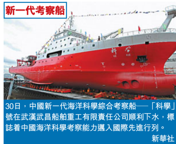
30日,中國新一代海洋科學綜合考察船——「科學」號在武漢武昌船舶重工有限責任公司順利下水,標誌着中國海洋科學考察能力邁入國際先進行列。

朝天門是重慶市的標誌性區域,位於重慶城北長江、嘉陵江交匯處,襟帶兩江,江面廣闊,百舸爭流;壁壘三面,地勢中高,兩側漸次向下傾斜,人行石階沿山而上,氣勢極為雄偉。朝天門是公元前314年,秦將張儀滅亡巴國後修築巴郡城池時所建。明初重慶府指揮使戴鼎擴建重慶舊城,按九宮八卦之數造城門17座,其中規模最大的一座城門即朝天門。門上原書四個大字:「古渝雄關」。古時欽差自長江上行經朝天門傳來聖旨,歷代地方官在此接旨,因古代稱皇帝為「天子」,「朝天門」故此而得名。