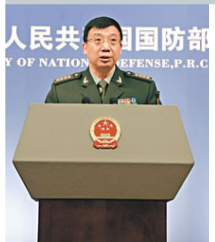
■耿飭生就航母平台試驗、解放軍組建戰略規劃部等問題回答記者提問。

香港文匯報訊(記者 李茜婷 北京報導) 在國防部30日舉行的例行記者會上,有記者問:前幾天中國海軍艦艇編隊從琉球區域的公海橫穿進入太平洋,有境外媒體認為這是中國航母編隊未來的航行路線圖,請予以證實。國防部新聞事務局長、新聞發言人耿飭生表示,中國海軍艦艇編隊赴西太平洋訓練,是一次例行的安排。航母平台29日再次出海試驗是按照整個研制定程確定的,這兩者之間沒有什麼聯繫。