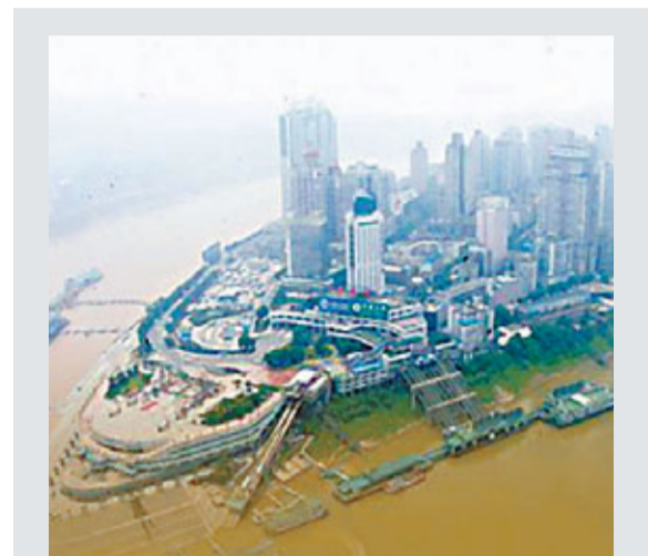
朝天門目前的景象。

新項目將銜接集停車場、地鐵站、公交通樞紐、客運碼頭和遊輪中心的水陸交通樞紐。如此龐大的建築群落地,意味著渝中區政府將面臨繁重的拆遷任務,朝天門「船頭」附近是已建成區,當地政府如何確保將「熟地」交給投資方,面臨較大挑戰。