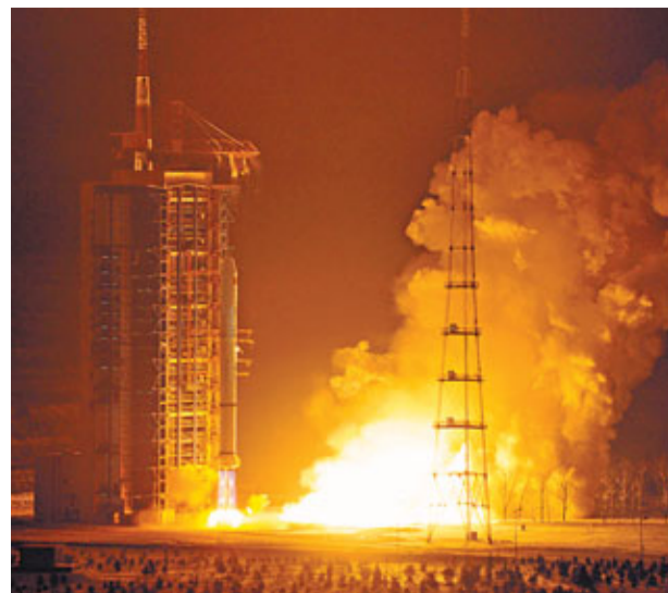
30日,載有「遙感衛星十三號」的「長征二號丙」運載火箭從太原衛星發射中心點火升空。

專家表示,中國目前在軌運行的遙感系列衛星,均屬太陽同步軌道衛星,其軌道高度大約為400到500公里。遙感衛星互補互補、相互配合,正逐步形成完善的網絡服務平台。特別是在抗擊汶川大地震、舟曲特大泥石流等重大自然災害中,遙感系列衛星通過實時對地成像觀測,為地面指揮、防災救助、災情核實、恢復重建等提供了海量支持信息。