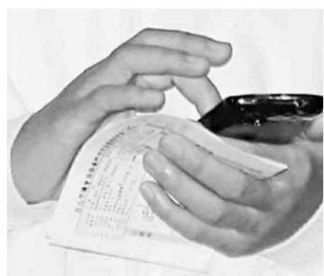
■「總統」候選人隨扈使用智能手機，竟存在維安漏洞。

據中通社28日電 正當大選迫近，馬英九正為選務而四處跑場時，有負責貼身保護馬人身安全的特勤人員竟在執行公務時沉迷玩手機的「打卡」(用手機在臉書Facebook上發表自己所在位置的資訊)功能，此舉實時暴露了馬英九的正確位置，恐在選舉敏感時刻為馬英九帶來不必要的安全風險。