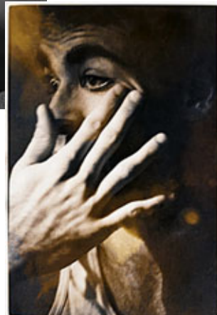
摸索找尋攝影師心像的溝通過程。

新作品叫Transferter「影像轉移」，當我拍下路途上的一些觸動，像影子在牆上飄拂的片段，我記下了時間，也包括這些瞬間即逝會被遺忘的一刻，影像的凝固記錄了某種記憶。