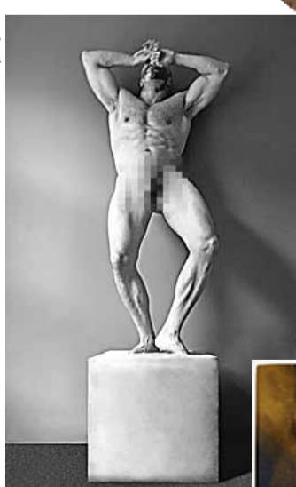
李志超《祭壇三聯像》之中