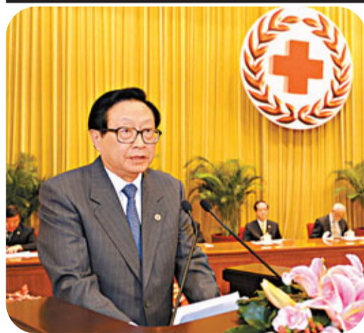
中國紅十字會的人員招聘納入國家公務員序列統一組織，有強烈的官方色彩。圖為中國紅十字會會長華建敏。