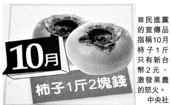
■民進黨的宣傳品指稱10月柿子1斤只有新台幣2元，激發果農的怒火。

想以農民議題攻擊對手，卻未料石頭反砸自己腳上，民進黨主席蔡英文27日強調「誤會了」，她指每