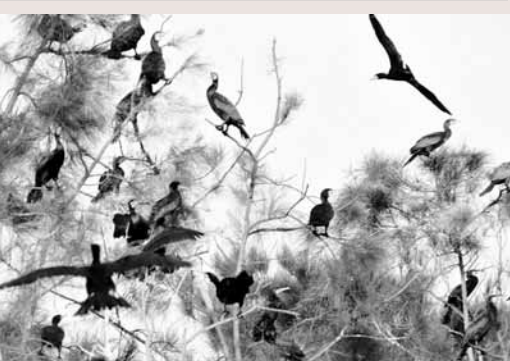
■據估計已經有5000隻鷗鷺飛抵金門棲息度冬。中央社

據中央社27日電 金門進入冬季賞鳥季節，已經有5000隻鷗鷺飛抵度冬，鳥況愈來愈好，金門縣野鳥學會27日在古寧頭舉辦賞鳥活動，鳥迷迎接北方嬌客來臨，共譜冬季戀歌。