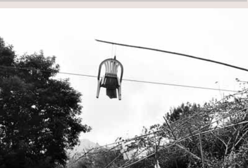
■果農設陷阱防野猴子偷吃，在電線上架著一把塑膠椅。中央社

據中央社27日電 正值台中市和平區甜柿盛產期，入山區到處可看到果園內套袋的甜柿已紅熟成熟，但最近卻傳出有猴群肆虐，加上山豬也來搶食，果農只好上天下地都架陷阱，以避免心血白流。