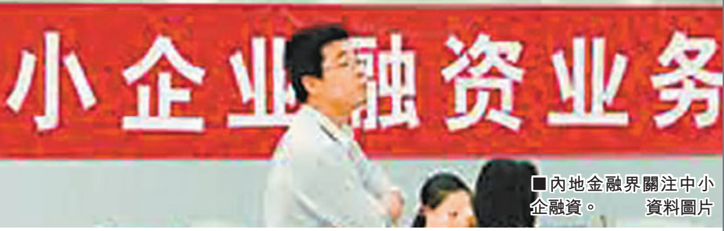
內地金融界關注中小金融。資料圖片

針對小微企業因下游回款慢使資金周轉困難的情況，工商銀行近日創新推出了電子供應鏈融資業務，幫助小微企業緩解資金周轉壓力。電子供應鏈融資通過與供應鏈核心企業的ERP（企業資源規劃）系統實時對接，將網絡融資嵌入供應鏈交易鏈當中，簡化傳統供應鏈融資業務流程，實現了融資的自動化、便捷化和跨區域功能。