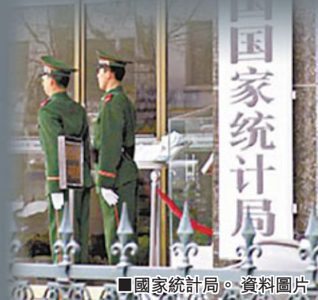
國家統計局。資料圖片

馬建堂還表示，要進行統計體制的改革，使統計數據更真實、可信，應從體制上確統計機構的中立性、盡可能減少行政干預。此外，目前統計項目太多，數據要報送很多部門，企業不堪重負。今後，應強化國家統計與行業統計的協調，嚴格規範部門統計項目，減少不必要的統計項目。