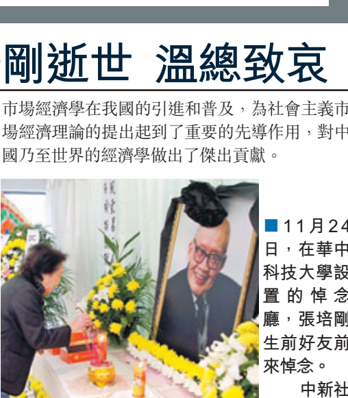
11月24日，在華中科技大學設置的悼念廳，張培剛生前好友前來悼念。

他認為，緩解當前中小企業面臨的困難，需進一步採取有效措施，積極推動扶持中小企業發展的各項政策落實，如加快民間資本進入金融領域的步伐，大力發展小型金融機構，加快建立並完善中小企業服務體系，建立共享式技術創新服務平台等。