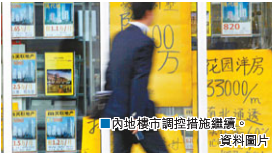
內地樓市調控措施繼續。

10月全國平均房價首次出現環比下降，打破持續了一段時間的價格僵局。有專家指出，地方政府土地財政與融資平台對房地產市場，主要是土地價格依賴過深，房價持續低迷後，地價先行走低，土地出讓金大幅萎縮。地方上不僅融資壓力巨大，還直接導致系統債務風險。因此，需堅持房地產調控不放鬆，讓地方政府意識到經濟發展和城市建設必須轉向真正的產業結構升級和技術進步。