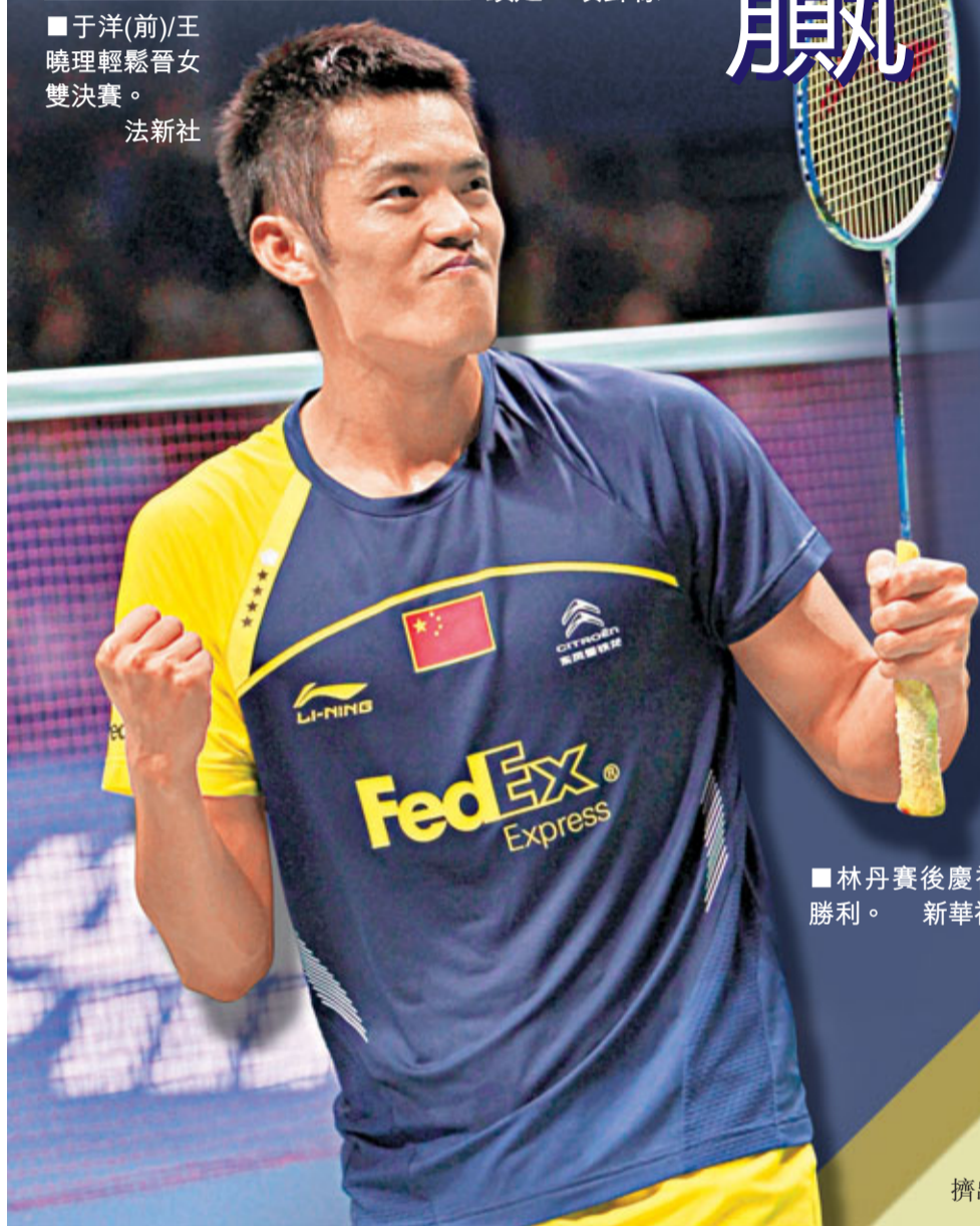
林丹賽後慶祝勝利。