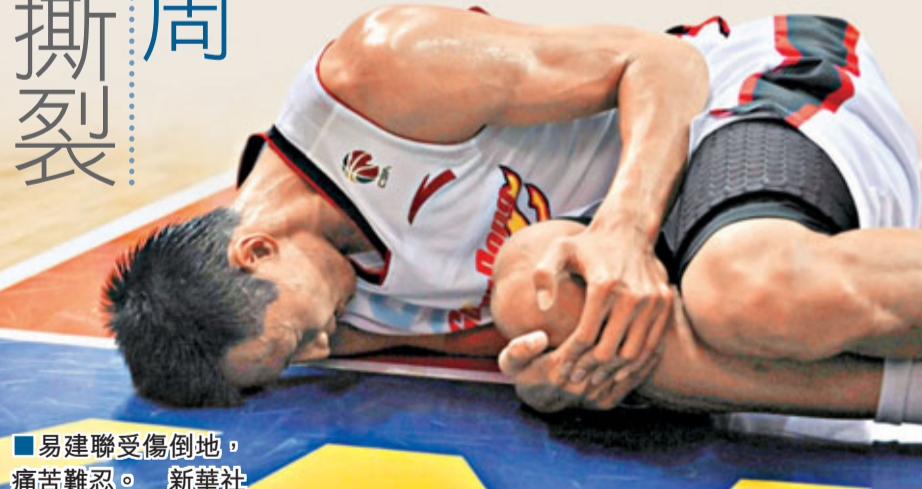
易建聯受傷倒地，痛苦難忍。