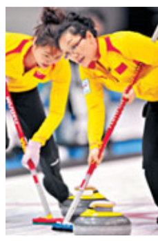
香港文匯報訊(記者 陳曉莉) 2011年太平洋冰壺錦標賽在南京奧體中心完美收官。主場作戰的中國隊表現出色，包攬男、女兩個項目的金牌，並雙雙獲得明年世錦賽參賽席位，在進軍冬奧會的道路上邁出堅實一步。其中，壓軸大戰女子組決賽，中國隊以11:3完勝韓國，成功奪魁。韓國隊獲得亞軍。而之前進行的男子組決賽，由中國隊對陣新西蘭隊。結果中國隊以5:2輕取對手，新西蘭隊獲得亞軍。