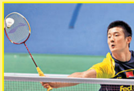
諶龍2:0橫掃印尼的桑托索晉級決賽。