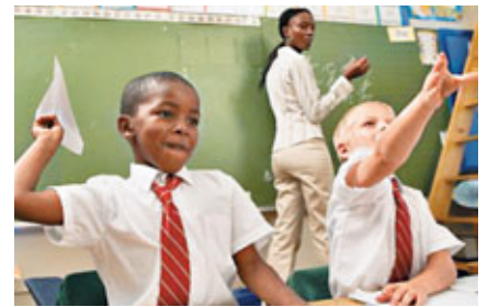
■挪威新移民不滿校方分班制。

挪威一間高中為了挽留本地生於校內就讀，竟實施了種族隔離式的分班制度，備受教育界及學生家長抨擊。但也有政界力撐該校的做法，指槍手布雷維克事件令有關討論變得「情緒化」，該名極右狂魔因反對移民等而大開殺戒。 據報，位於奧斯陸的比耶克高中，去年有多名挪威本地生轉校，所以將該校的通識科分為3班，其中1班只由移民子女組成。校長解釋，由於校內有些班別的學生大部分來自其他族裔，使本地生認為自己是少數，故決定轉校。本月初，該校一名印巴裔學生的父親，前去學校投訴，質問為何兒子班內沒有挪威同學，繼而揭發事件。 ■《每日電訊報》