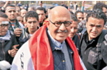
埃及傳媒昨日報導，當地軍政府最高領袖坦塔維，與兩名總統候選人巴拉迪(見圖)及穆薩分別會面。另一方面，示威者對曾效力穆巴拉克的詹德里獲任命為新總理，表示強烈不滿，昨日的抗議行動中有1名示威者被警車撞倒，傷重死亡。 ■法新社/路透社

據報，該名示威者於國會總部外抗議會館里獲任新總理，其間被警車撞倒，造成多處骨折及嚴重內出血。內政部發表聲明表示深切同情及歉意。 此外，數百名示威者在明日舉行大選前夕，繼續於開羅解放廣場紮營。示威者於廣場內高呼「詹德里下台」的口號，有示威人士質疑軍政府任命詹德里為總理，暗示其不願交出權力。前日有數以千計的示威者聚集，要求軍政府立即交出權力，但軍方拒絕，只承諾提早於明年年中舉行總統大選，並任命詹德里籌組新政府。 ■法新社/路透社