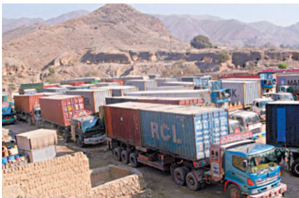
■北約補給車在通往阿富汗途中大塞車。

北約直升機前日向巴基斯坦西北部發動襲擊，造成28人死亡，北約發言人承認「非常可能」誤殺巴國士兵。巴國其後作出「反擊」，關閉北約在巴國邊境通往阿富汗的陸路主要通道，阻止北約運送物資的貨車、燃料車等通過，據當地軍官指，約40輛物資補給車輛要折返。北約發言人指，該條通道是北約運送物資予駐阿軍隊的重要陸路通道。運送予駐阿軍隊的物資中，約49%取道巴國。