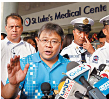
■將自己舉丸當作賭注的阿羅約夫人律師托帕修。