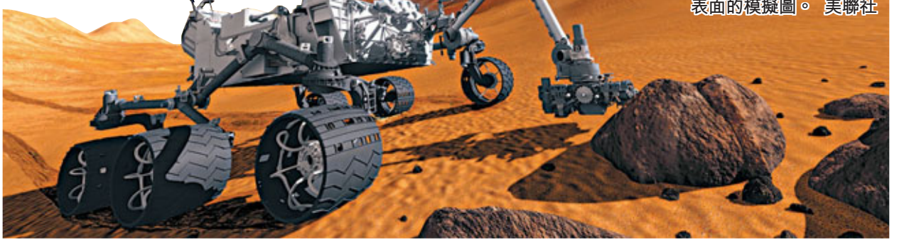
■「好奇號」探索火星表面的模擬圖。