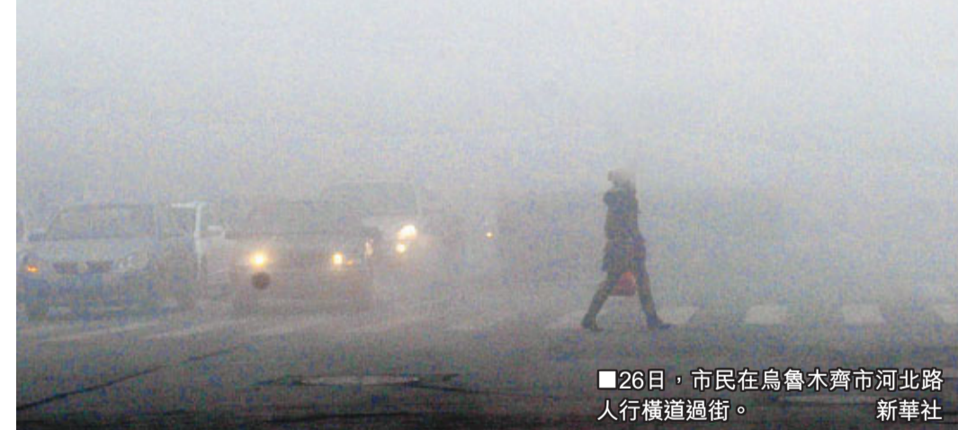
26日，市民在烏魯木齊市河北路人行橫道過街。

航班取消，1個航班返航，約7000名旅客滯留機場。新疆氣象部門表示，今年11月烏魯木齊出現的大霧天氣次數已超越去年同期。下午17時37分，烏魯木齊國際機場開始恢復正常。截至19時，儘管烏魯木齊國際機場機場已經恢復正常，但烏魯木齊市區依舊被濃霧籠罩，部分地區能見度不足50米。