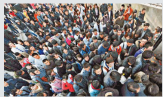
公務員考試考生擠破頭。