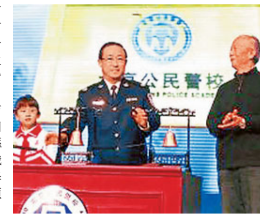
北京市公安局長為警校揭牌並上第一堂課。

北京警方介紹，北京公民警校主要課程包括警察文化理念、各職能部門面向社會公眾的相關警務工作、社會群防群治、治安災害預防。在警校學習的公民將重點接受安全意識方面的教育，了解常見的火災、爆炸、溺水、觸電、食物中毒、煤氣中毒、高空墜落、交通事故、集體擠踏等治安災害事故，並學會預防和應對這些事故的能力。同時，公民警校還會大力培訓警務力量，提高輔警及保安隊伍人員的綜合素質。