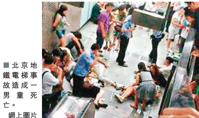
北京地鐵電梯事故造成一男童死亡。