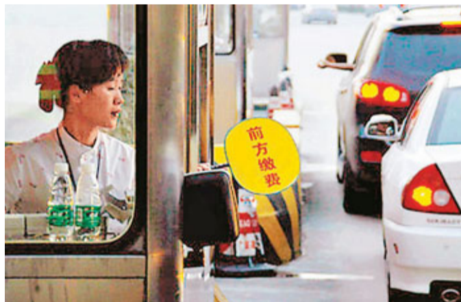
內地公路收費雖多，卻多數入不敷出。