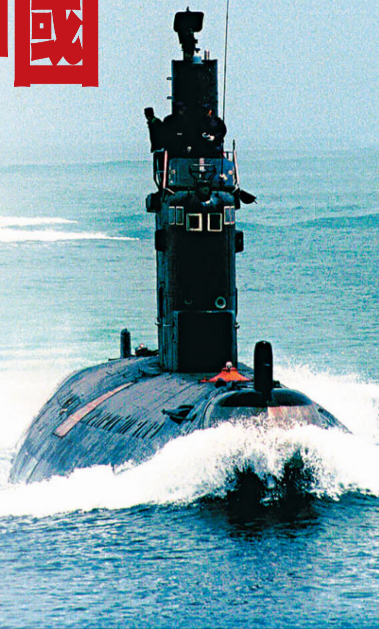
■美媒指中國海軍日前赴西太平洋進行訓練的消息牽動西方神經。圖為中國海軍潛艇編隊。資料圖片