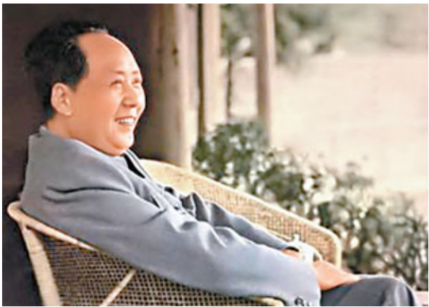
毛澤東性格的另一個特點是倔強，說一不二，不容反對。