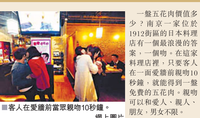
客人在愛牆前當眾親吻10秒鐘。

一盤五花肉價值多少？南京一家位於1912街區的日本料理店有一個最浪漫的答案，一個吻。在這家料理店裡，只要客人在一面愛牆前親吻10秒鐘，就能得到一盤免費的五花肉。親吻可以和愛人、親人、朋友、男女不限。店主介紹，除了真正意義上的嘴唇表示情侶之間的愛意外，異性好友間還可以用碰觸額頭表示關心呵護對方、貼臉頰表示兄弟姐妹或朋友的情誼，「我們更鼓勵兩個或多个好友有愛的陌生人親親，即便大家不認識，也可以通過這種方式表達自己熱愛生活與他人的情感。」