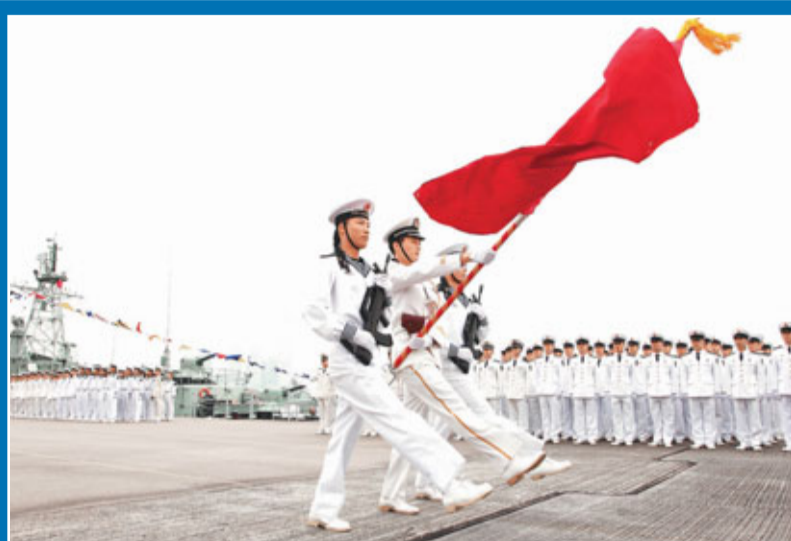
■在一片激昂的樂曲高奏下，駐港部隊海軍官兵在昂船洲軍營列隊，迎接徐徐駛入港口的1艘導彈護衛艇及1艘登陸艇。