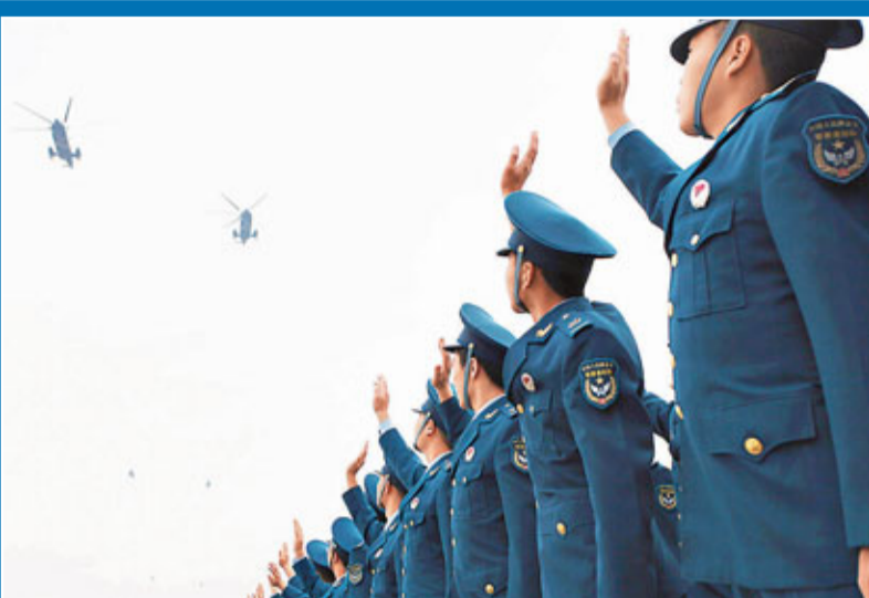
■輪換出港的6架直升機，在軍營上空繞飛一周後離港，完成駐港空軍部隊輪換行動。空軍官兵揮手告別依次飛離的直升機。