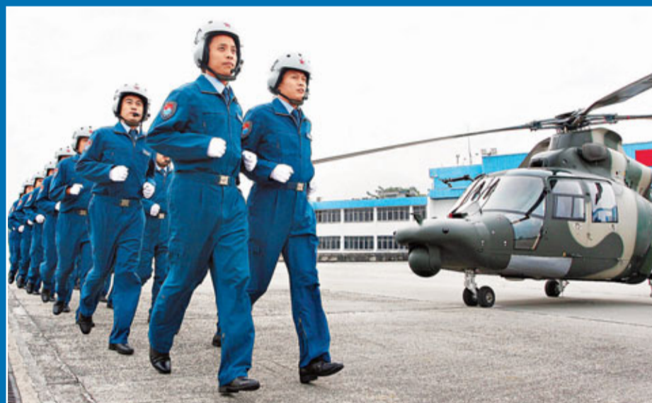
■空軍部隊在石崗機場進行部隊輪換行動。

香港文匯報訊（記者 聶曉輝）11月25日零時，一輛接一輛運兵車、裝甲車及通訊車，在香港警方開路下，浩浩蕩蕩從落馬洲口岸駛進解放軍駐港部隊各軍營，展開解放軍駐港海、陸、空部隊第十四次輪換行動。駐港部隊副司令員董朝大校率領2名軍官在口岸迎接輪換駐港官兵。至昨日中午，輪換行動圓滿結束。駐港部隊副司令員周松和少將指，履行香港防務職責，使命神聖、責任重大，輪換駐港官兵將堅決貫徹落實「一國兩制」偉大方針，嚴格遵守《基本法》、《駐軍法》及香港法律，不斷強化使命感與責任感，為維護香港長期繁榮穩定作出積極貢獻。