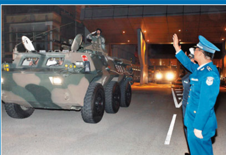
■昨日午夜零時，一輛接一輛運兵車、裝甲車及通訊車在香港警方開路下，浩浩蕩蕩從落馬洲口岸駛進解放軍駐港部隊各軍營。

香港文匯報訊（記者 聶曉輝）11月25日零時，一輛接一輛運兵車、裝甲車及通訊車，在香港警方開路下，浩浩蕩蕩從落馬洲口岸駛進解放軍駐港部隊各軍營，展開解放軍駐港海、陸、空部隊第十四次輪換行動。駐港部隊副司令員董朝大校率領2名軍官在口岸迎接輪換駐港官兵。至昨日中午，輪換行動圓滿結束。駐港部隊副司令員周松和少將指，履行香港防務職責，使命神聖、責任重大，輪換駐港官兵將堅決貫徹落實「一國兩制」偉大方針，嚴格遵守《基本法》、《駐軍法》及香港法律，不斷強化使命感與責任感，為維護香港長期繁榮穩定作出積極貢獻。