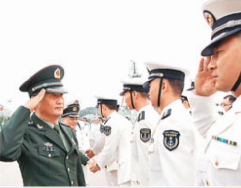
■駐港部隊第十四次建制單位輪換及退役士兵離港。