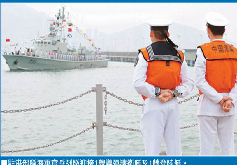
■駐港部隊海軍官兵列隊迎接1艘導彈護衛艇及1艘登陸艇。

是次輪換單位包括駐港部隊部分陸軍分隊、空軍直升機大隊及海軍艦艇。在新圍陸軍軍營、石崗空軍軍營及昂船洲海軍軍營，進出香港的部隊先後進行簡單而莊嚴的防務交接儀式，整個輪換行動井然有序。