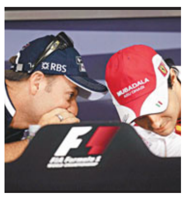
巴里哲奴(左)希望繼續馳騁F1賽場。

馬沙勸老同鄉退位 季結束後退役，不願看到這名史上參加F1場數最多的車手要四出尋找贊助強留在F1。馬沙勸諭巴里哲奴說：「我給他的建議是：退役。我認爲巴里哲奴擁有一個難以置信的F1生涯，參加最多比賽，還贏了不少分站冠軍，這是很多車手夢寐以求的。我建議他退役不是因爲覺得他已老，而是現在F1有12支車隊，有5至6支車隊都是要交錢才能獲得位置，我認爲這很可笑。我不能接受像巴里哲奴這樣一位在F1取得如此成就的車手去尋找贊助商。」