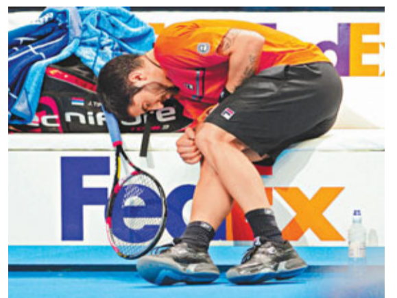
帖沙耶域治檢查腳部傷勢。