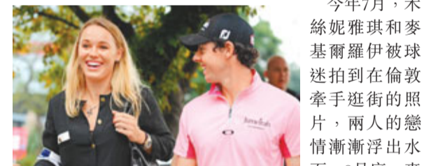
禾絲妮雅琪(左)與麥基爾羅伊如膠似漆。

丹麥網球甜心禾絲妮雅琪周三向當地媒體否認了與北愛爾蘭高爾夫球明星麥基爾羅伊在2012年結婚的傳言，她說：「我認為這(結婚)還要等上好幾年……。」禾絲妮雅琪與麥基爾羅伊的戀情受到媒體和公眾的廣泛關注，英國博彩公司甚至對禾絲妮雅琪是否在2012年結婚這一懸念開出了賭盤。