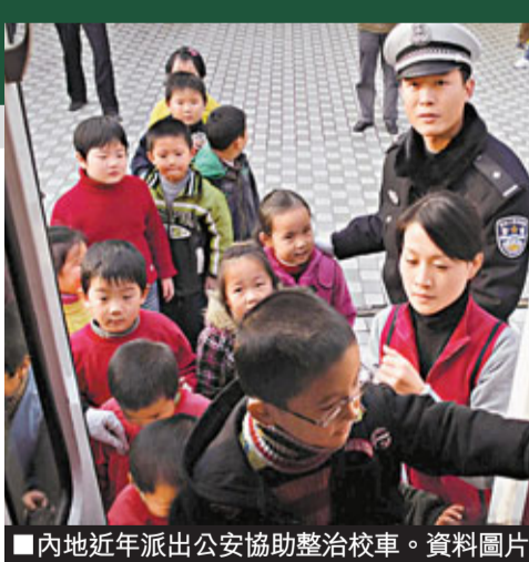
內地近年派出公安協助整治校車。 資料圖片

內地政府可參考美國和加拿大等地方的經驗，加強校車安全的法規，如對校車司機有嚴格的法例要求，校車在道路上享有特殊待遇，校車品質有一定標準等。