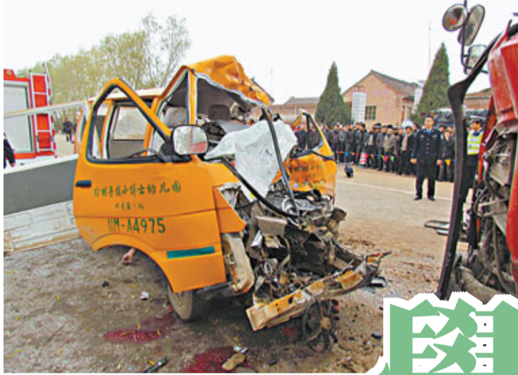
本月中，甘肅省榆林子鎮發生一宗運煤貨車與接送幼兒園學生麵包車相撞的交通意外，造成19人死亡。 資料圖片