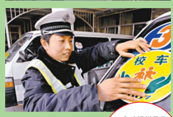
內地銀川早已統一校車黏貼標誌，當局規定所有校車必須有此標誌才能運送學生。 資料圖片