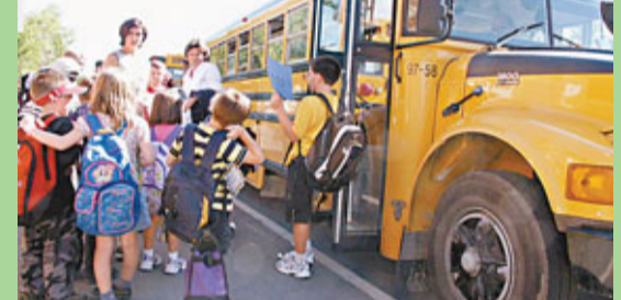
部分海外國家的校巴受到政府的嚴格監管。圖為加拿大渥太華學生乘坐校車上學。 資料圖片