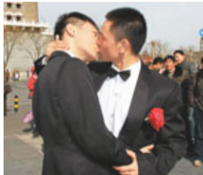
■一對「男同志」戀人在京城鬧市拍婚照。

如今，數以萬計的中國「同妻」們，已經團結起來開始自救，並用開網站、設熱線、成立QQ群等方式，救助同病相憐的姐妹。備受命運戲弄的她們喊出「同妻到我為止」的口號，不僅是對自身遭遇的自憐，更充滿對後來者的悲憫。時代在發展，在周遭很多國家已經承認同性婚姻的當前，有識之士呼籲，對同性戀文化應更加開放更加寬容，並能更積極地推進同性戀合法化，讓「同妻」到現在為止。