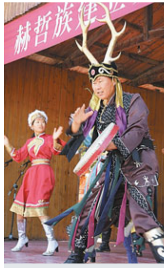
■赫哲藝人正在說唱「伊瑪堪」。

由於赫哲族只有語言沒有文字，伊瑪堪這一古老的敘事傳統和口頭藝術，成為該民族傳承歷史文化、宗教信仰、人文習俗等的唯一形式，堪稱赫哲族僅存的「活的歷史教材」。