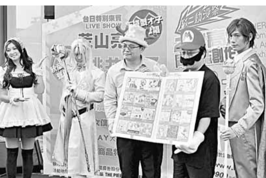
官員也迷動漫 高雄市官員(右2、3)化身為動漫人物，為即將登場的「同人誌創作展」宣傳。

在台北捷運市政府站，哺乳室外可見有清晰的標識；哺乳室內則特意以溫馨的粉紅色調裝飾，為媽媽們提供了舒適的沙發、洗手設備以及緊急求救鈴。捷運站人員稱，鑒於捷運站人員流量大，為了保護哺乳媽媽，還專門配備反偷拍設施。