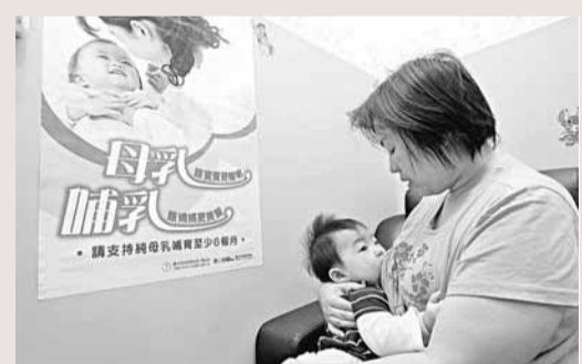
台北市推行新規定，在特定場所應設置哺乳室。

據中新社24日電 有網路笑話說，一位餐廳經理禁止女顧客在餐廳內餵嬰兒哺乳，理由是，本餐廳禁止自帶食品。不過，台灣的媽媽們「自帶食品」可是有法令的保護，而且從24日起，她們在法定場合必須提供母乳哺育的專用場所，否則，相關單位荷包就得「出血」了。