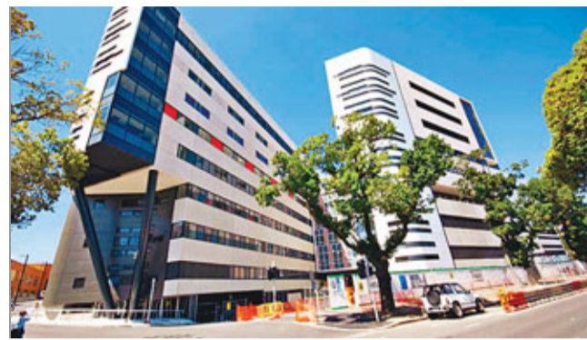
皇家女子醫院是澳洲最大型的婦科醫院。 網上圖片