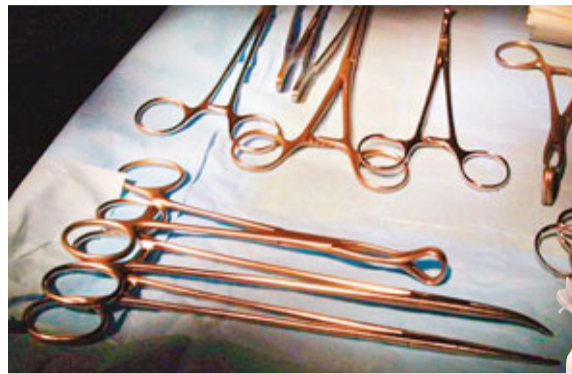
人工流產令事主身心遭雙重打擊。

澳洲驚爆罕見嚴重醫療事故，墨爾本一名身懷32周雙胞胎的孕婦，得悉其中一胎患先天性心臟缺陷，出生後會「手尾長」，故接受建議，於周二接受人工流產。然而醫生竟錯誤將健康胎兒打掉，慘失一子的受害人被迫再次終止懷孕，把患有先天缺憾的另一男胎兒拿掉，肉體、精神遭雙重打擊。醫院形容這是可怕悲劇，公開向受害者及家屬致歉並展開調查。