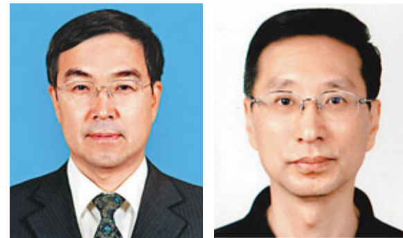
■央視前台長焦利 ■新任央視台長胡占凡

香港文匯報訊（記者 江鑫 北京報導）新華社24日發佈消息稱，中央決定，任命胡占凡為中央電視台台長（副部長級），免去焦利中央電視台台長職務，另有任用。有分析稱，胡占凡上任後，央視直播分離等改革能否深化，值得期待。