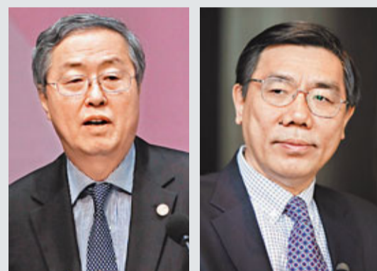
■央行行長周小川 ■工行行長姜建清

據《財經》24日報導，中國新一輪金融人事佈局拉開了序幕。隨着三大金融監管部門——銀監會、證監會、保監會「三會」主席同時更替。在三會換帥之際，63歲的央行行長周小川的去留引人關注，「匯改」、「利率市場化」仍是央行未來亟待解決的難題。知情人分析，接替周小川的，很可能是工行行長姜建清，「姜赴任央行還存在不確定性，在十八大前應該會有結果」。 同時據媒體報導，審計部門已於6月啟動了對工行董事長姜建清的經濟責任審計，分多個組對十幾個省市分行進行了審計，該審計已於9月底完成。 工行的領導班子一直十分穩定，姜建清主政工行已經長達11年，在其任上，工行完成了股改上市，成為市值最大的銀行。各界預計，姜建清調赴新的崗位應是時間問題。