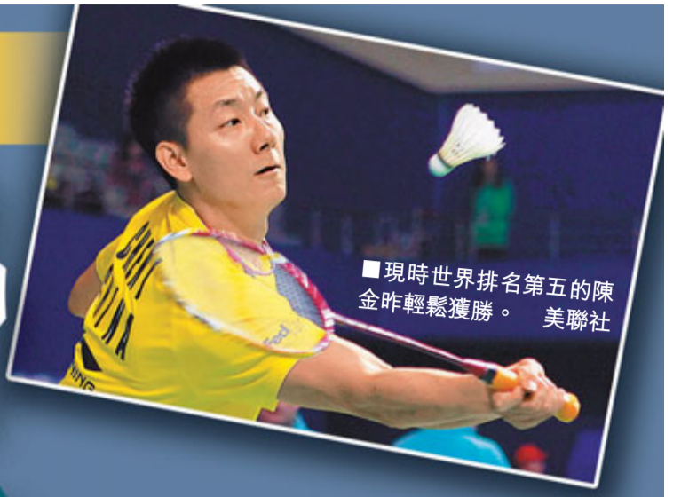
現時世界排名第五的陳金昨輕鬆獲勝。