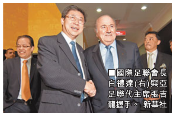
國際足聯會長白禮達(右)與亞足聯代主席張吉龍握手。

委員會上達成的B方案，即中日韓各獲4個亞冠名額的決定，而最終通過A方案，即中國亞冠名額被縮減到3.5個。