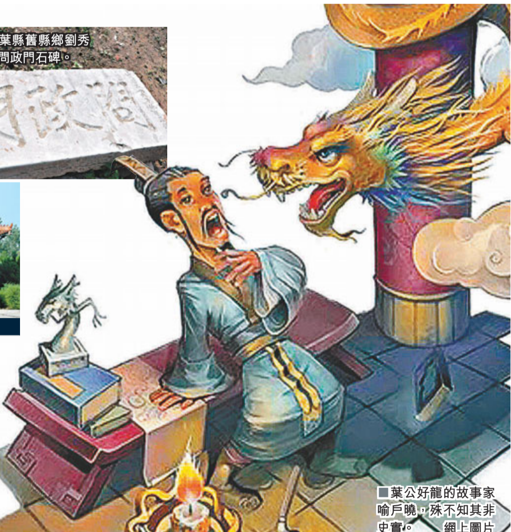
葉公好龍的故事家喻戶曉,殊不知其非事實。網上圖片