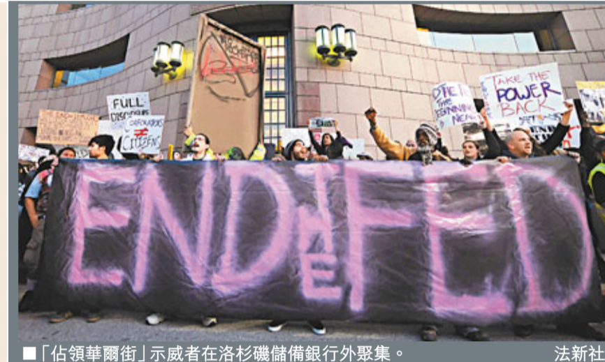
佔領華爾街示威者在洛杉磯儲備銀行外聚集。