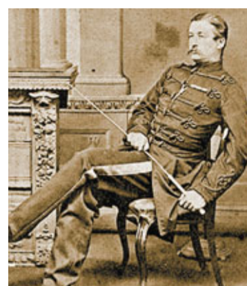
金特是搶掠圓明園的英軍軍官之一。