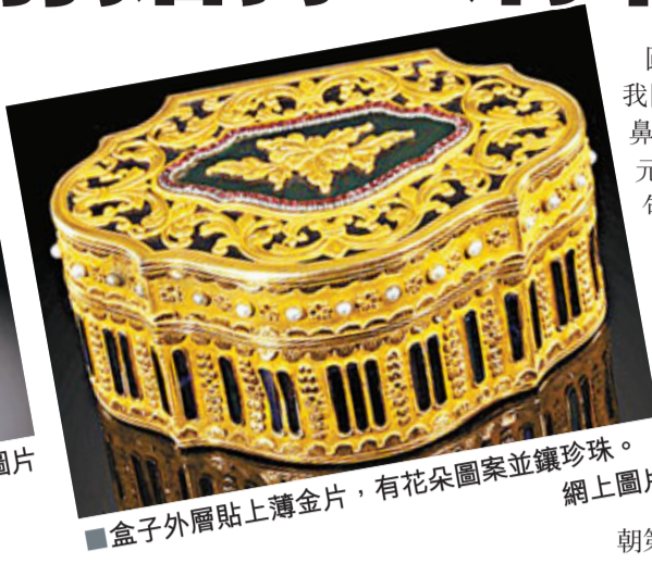
盒子外層貼上薄金片，有花朵圖案並鑲珍珠。

圓明園寶物眾多，當年英法聯軍盜去我國不少瑰寶。百多年過後，一個鍍金鼻煙盒拍賣得49萬英鎊（約595萬港元），高價竟來自盒上刻上的無恥字句：「掠自圓明園」。