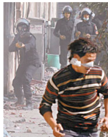
防暴警察向示威者發射橡膠彈。

埃及民眾反軍政府示威持續第5天，執政武裝部隊最高委員會主席坦塔維前日終於低頭，宣布接受內閣請辭，組建民族拯救政府，並首次確定明年6月為總統大選日期，下週國會大選亦將如期舉行。不過民眾仍不滿安排，繼續在開羅解放廣場示威並與警方衝突，昨日造成最少3人死亡。YouTube上流傳有警員更向示威者雙眼發射橡膠子彈的片段，令全國震怒。