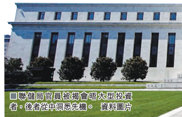
聯儲局官員被揭會晤大型投資者，後者從中洞悉先機。