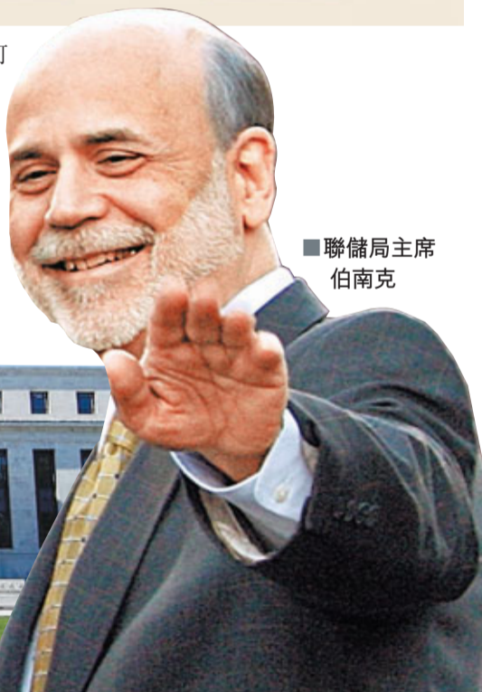
聯儲局主席伯南克