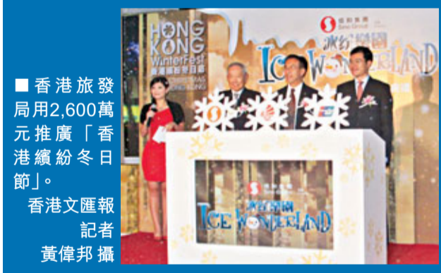
香港旅發局用2,600萬元推廣「香港繽紛冬日節」。