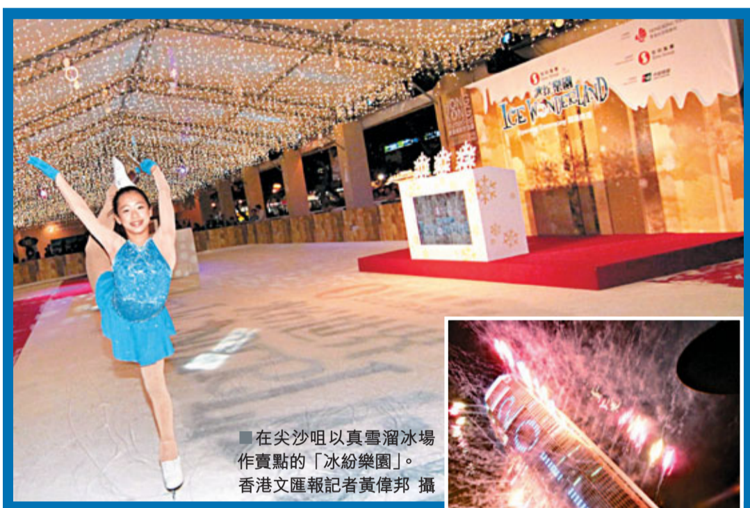
在尖沙咀以真雪溜冰場作賣點的「冰紛樂園」。

田北俊表示, 根據初步數字, 今年首10個月訪港旅客已超過3,400萬人次, 較去年同期增加16%, 期望透過推廣「香港繽紛冬日節」, 料全年訪港旅客可達到4,000萬人次的目標。