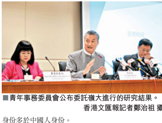
青年事務委員會公布委託嶺南大學進行的研究結果。

青年事務委員會委託嶺南大學就香港青年發展指標進行調查及研究, 用問卷及電話調查方式訪問了5,195名16歲至24歲年輕人, 在人口概況、教育、就業、身心健康、犯罪與偏差行為、閒暇安排及消費傾向、公民與社會參與、價值觀、競爭力9個方面的情況。整體研究結果顯示, 時時的香港年輕人大部分都有明確生活目標, 他們的社交能力水平良好, 但抗逆力一般, 對自己的英語能力亦欠缺信心, 普遍認同香港人