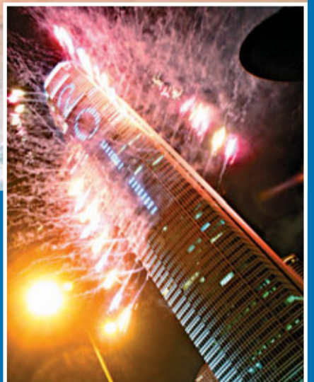
在國金2期舉辦的「除夕倒數詠香江」匯演, 400萬元贊助費將由政府承擔。資料圖片