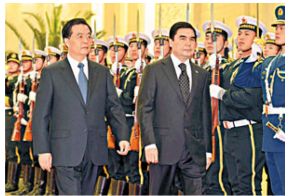
■胡錦濤舉行儀式，歡迎別爾德穆哈梅多夫。新華社哈梅多夫。溫家寶表示，中土務實合作勢頭良好，前景廣闊。雙方要加強天然氣領域上下游一體化合作，建立長期穩定的能源戰略夥伴關係；擴大非資源領域合作和高科技合作，密切兩國地方交往，使雙邊經貿關係實現均衡、全面、高水平發展；加強安全執法合作，確保大型項目順利實施和運營。