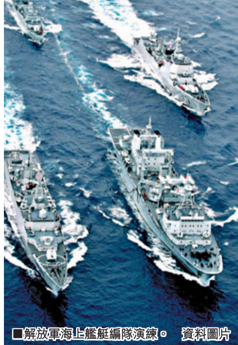
■解放軍海上艦艇編隊演練。資料圖片

香港文匯報訊（記者 葛沖 北京報導）國防部新聞事務局昨日發佈消息稱，解放軍海軍艦艇編隊於本月下旬赴西太平洋海域進行訓練。國防部和外交部均強調，今次訓練是年度計劃內的例行性安排，不針對任何特定國家和目標，符合相關國際法和國際實踐，中方在相關海域的航行自由等合法權利不應受到任何阻礙。