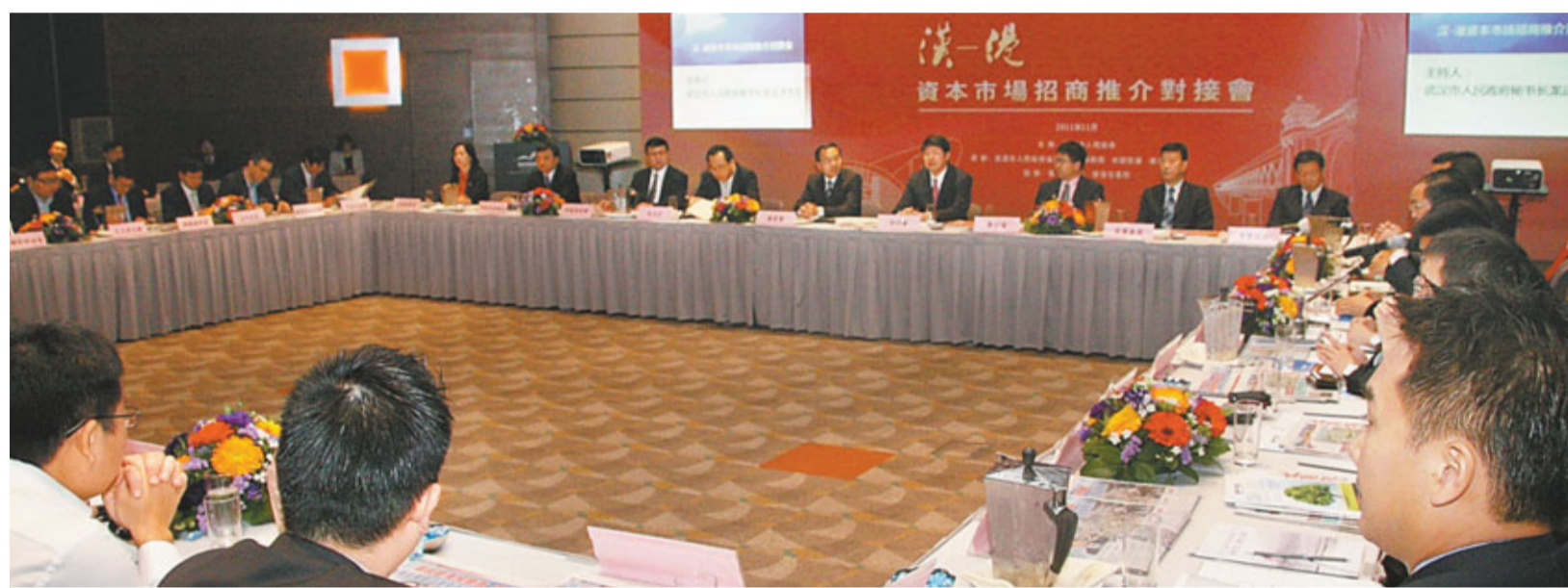
在「漢—港資本市場招商推介對接會」上,武漢市政府代表團與本港金融業界代表就金融業的發展作深入的交流。