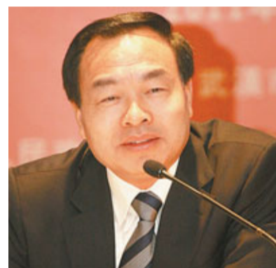
武漢市市長唐良智。

唐良智以跳高作為比喻,稱武漢獲得香港金融業的支持,就如同在跨越式發展過程中獲得「撐桿」,有了「撐桿」的助力,武漢可以跳得更高。