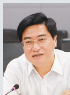
張光清表示,高新區一批新園區正陸續開建,發展勢頭良好。

香港文匯報訊(記者 俞鯤、通訊員 章歡)武漢東湖高新區管委會主任張光清接受本報專訪時表示,作為國家自主創新示範區,東湖高新區的自主創新能力正不斷提升。同時他亦表示,香港政府在扶植科技型企業發展上的眾多做法值得東湖高新區學習,雙方可以在企業和園區層面更多地交流學習。