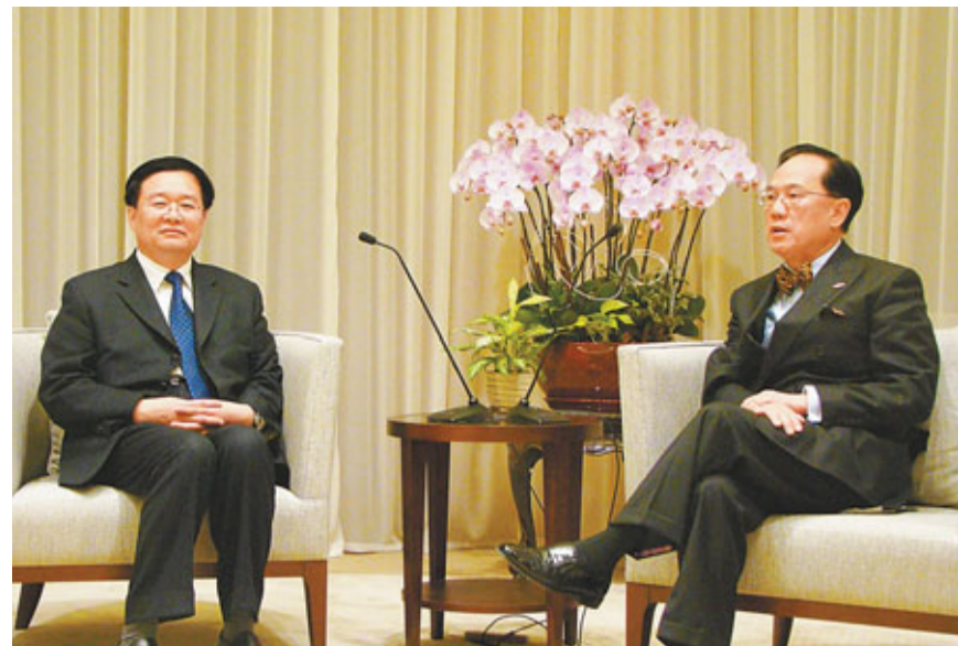
湖北省省長王國生(左)與香港特首曾蔭權會晤。

香港文匯報訊(記者 肖晶)正率團來港舉行2011鄂港(粵)經貿合作洽談會的湖北省省長王國生,昨日專程拜訪香港特首曾蔭權。曾蔭權在會面中表示,明年4月香港將在武漢舉辦「湖北武漢·香港周」活動,望獲得湖北省的大力支持。同時,雙方又為在湖北特設聯絡辦事處,共建合作示範區方面交換意見。