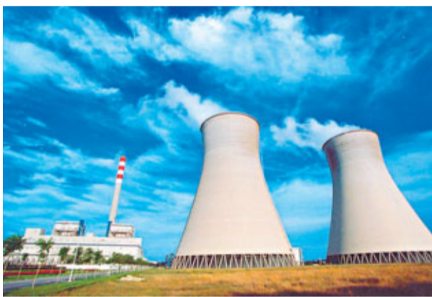
■神華收購電廠的條件包括能夠使用該集團煤炭。圖為該集團國華三河電廠。資料圖片

煤價不斷上漲,電企與煤企合作是市場大趨勢。被問及對明年煤價的看法,黃清預計夏季用電高峰時段及冬季備煤時段都會出現上揚,但成本亦同時上升。該集團今年首9個月噸煤開採成本上升8.2%,主要因人工上漲。另根據國家最新下達的資源稅細則,神華平均資源稅率為每噸煤炭3.2元人民幣。