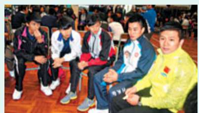
陳一冰(右)與中學生分享經驗。

香港文匯報訊(記者 潘志南)中國體操隊4位國寶級代表陳一冰、肖欽、楊伊琳和陸潔昨晨以大使身份,在香港體操協會會長霍啟剛陪同下,訪問天水圍東華三院郭一暉中學,並和同學進行交流,活動長達個半小時。