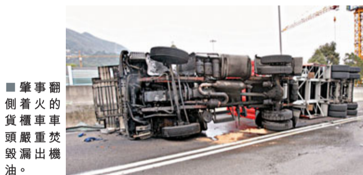
肇事翻側着火的貨櫃車車頭嚴重焚毀漏出機油。

現場消息稱,由於車頭不斷漏出燃油,並開始冒煙,隨着火一發不可收拾,司機生命懸於一線。幸在此