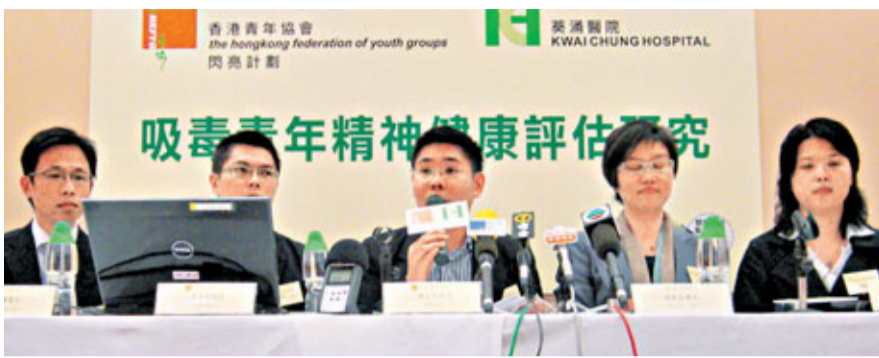
青協指出,現時社會只關注吸毒對身體的禍害,忽略對精神健康的影響。

香港文匯報訊(記者 林裕華)吸毒禍延終生,除了毒害身體,亦有損精神健康。青協評估吸毒青年的精神狀況後,發現近半數人出現焦慮症狀,23%受訪者的認知能力懷疑或證實已受損,出現集中力弱、記憶力轉差等問題,連簡單的加減數算式也未能應付。青協指出,近年吸毒青年更趨隱蔽化及「富貴化」,吸食貴價的可卡因,甚至舉行遊艇毒派對,以及租用4星級酒店房間吸毒。青協呼籲青少年認清毒品禍害,若發現身邊朋友吸毒,應及早向家長、老師及社工求助,切勿盲目跟隨沾染毒癮。