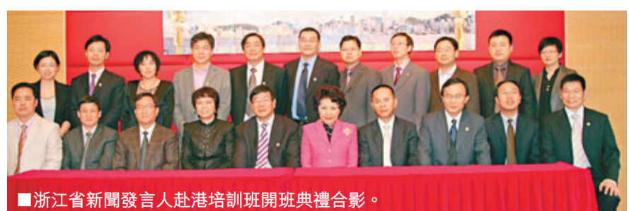
浙江省新聞發言人赴港培訓班開班典禮合影。

香港文匯報訊(記者 茅建興)由浙江省政府新聞辦與浙江省外國專家管理局主辦,香港文匯報和香港金融管理學院共同承辦的浙江省新聞發言人赴港培訓班,昨日在香港文匯報大禮堂舉行開學