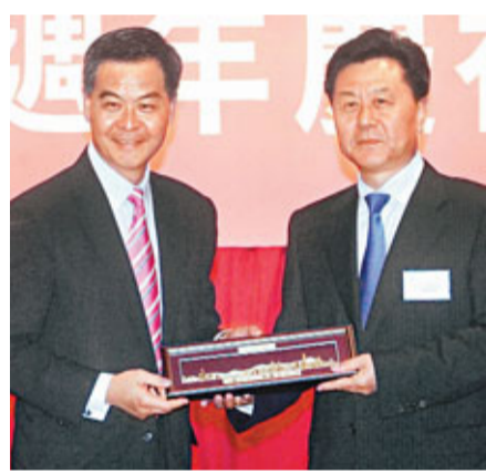
李剛(右)接受梁振英致送紀念品。

林瑞麟指出,香港專業人士和服務業領導層將專業知識與西方管理企業最佳模式結合,使香港不斷拓展新的發展空間,香港專業界支撐着香港以服務業為主