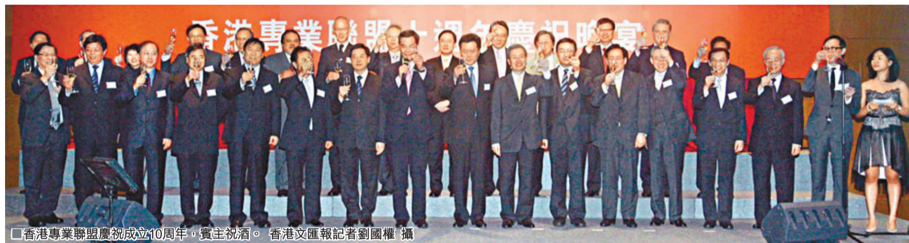
香港專業聯盟慶祝成立10周年,賓主祝酒。

香港文匯報訊(記者 沈清麗)香港專業聯盟昨晚假灣仔會展中心君爵廳舉行慶祝成立10周年晚宴。香港特區政務司司長林瑞麟,中聯辦副主任李剛,外交部駐港副特派員李元明出席主禮。香港專業聯盟主席梁振英,晚宴籌委會主席區翹翔及香港專業界代表逾200人聚首同慶,氣氛熱烈。