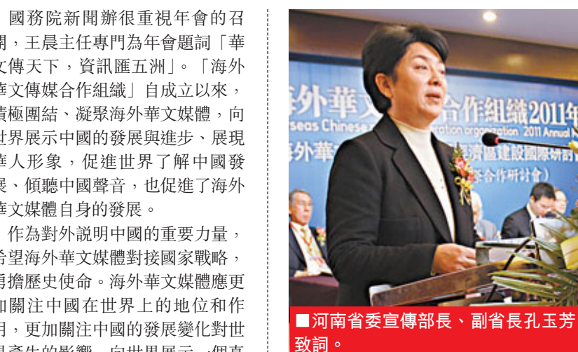
■河南省委宣傳部長、副省長孔玉芳致詞。