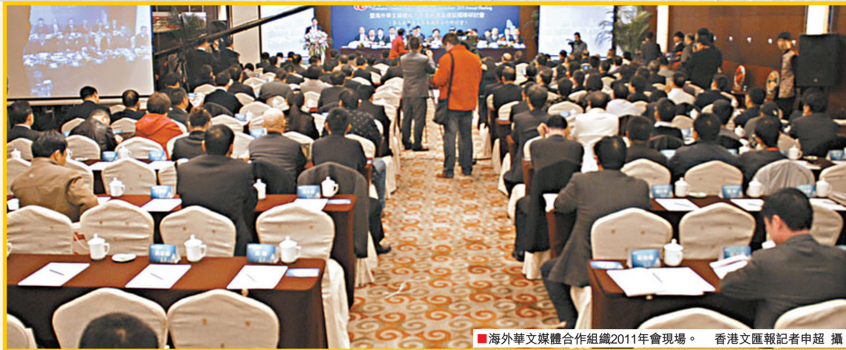
■海外華文媒體合作組織2011年會現場。