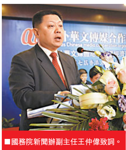
■國務院新聞辦副主任王仲偉致詞。

胡逸山教授建議，在新媒體的語境下，海外媒體可以把一些傳統角色進行重鑒，可以用一些高新科技把華媒的資訊活動更有趣、更有效傳開來。