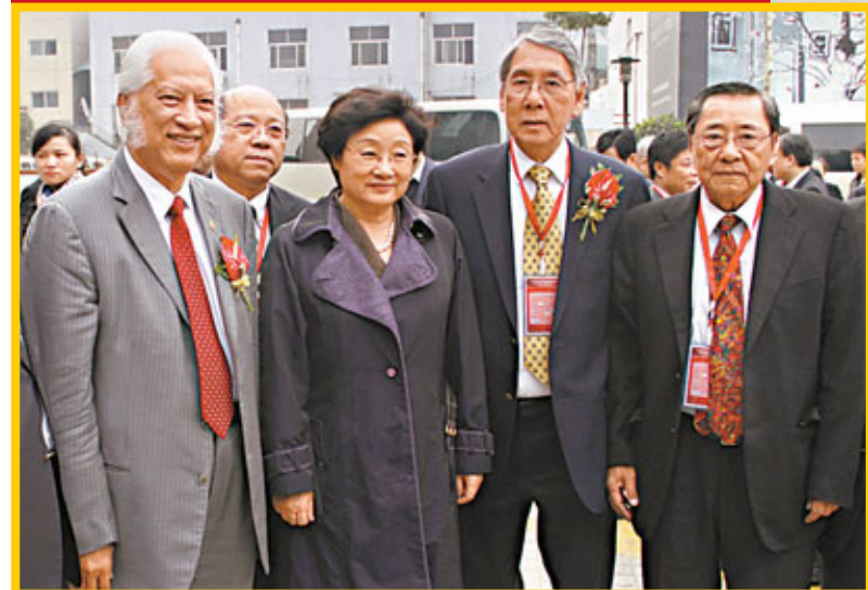
■國務院僑務辦主任李海峰(右三)，美國《國際日報》社長熊德龍(左一)等嘉賓合影。