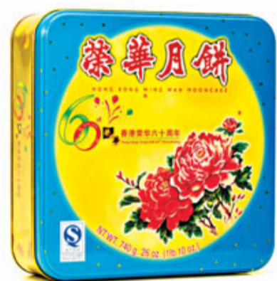
■香港榮華包裝。

香港文匯報訊(記者 肖郎平 東莞報道) 本港知名品牌「榮華月餅」在內地的商標紛爭不斷。近期，擁有榮華文字商標的順德蘇氏榮華提出重申要求並獲得最高院同意，還向香港榮華提起反訴索償9,000萬人民幣。11月17日，香港榮華在東莞指責對方此舉為漫天要價，稱之為「打劫者向受害者索賠賠償」的做法。