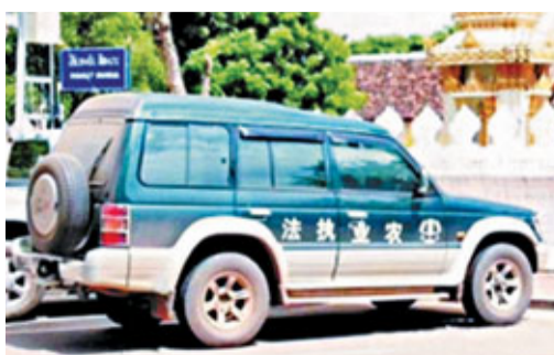
■此前有內地越野車被發現公車私用出現在越南某景點。

據中新網21日電 國務院法制辦公室今日在其官方網站公佈《機關事務管理條例(徵求意見稿)》(以下簡稱《徵求意見稿》)，徵求社會各界意見。其中針對目前社會高度關注的「三公」經費花銷作出了相當多的規定。其中規定政府須用中低檔公務用車，非特殊用途不得配越野車等。 徵求意見稿規定，縣級以上人民政府應當按照總額控制、從嚴從緊的原則，根據預算定額和開支標準編制機關運行經費預算；應當將公務接待費、公務用車購置和運行費、因公出國(境)費納入預算管理，嚴格控制其在機關運行經費預算總額中的規模和比例。政府各部門應當根據工作需要和機關運行經費預算，制定公務接待費、公務用車購置和運行費、因公出國(境)費支出計劃，不得挪用其他預算資金，不得攤派、轉嫁相關費用。 此外，政府各部門應當根據機關資產配置標準編制機關資產配置計劃，採購和配置資產；建立