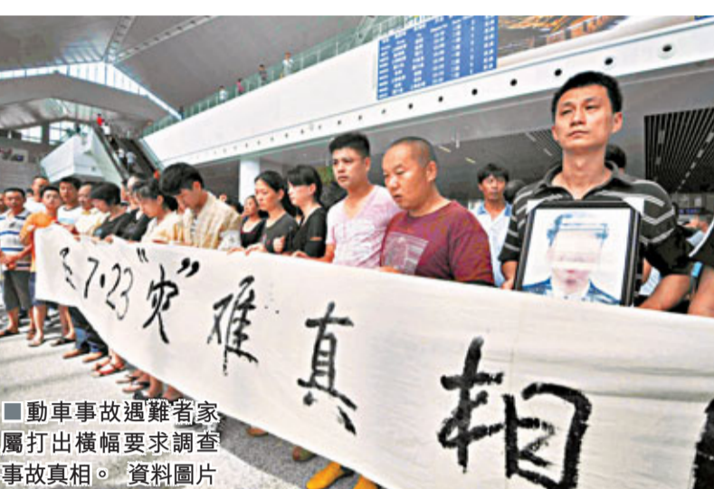
■動車事故遇難者家屬出橫幅要求調查事故真相。資料圖片

據動車事故調查專家組成員介紹，事故發生後，調查組立即對事故車輛殘骸等有關物證、數據資料進行了封存和保護，同時調取解讀分析了事故前後的錄音資料以及機車綜合無線通信設備等裝置、儀器、設備的全部信息。 事故3個月 報告無蹤影 之前有一種說法是雷擊引發了這次事故，對此，王夢恕表示，當時7分鐘雷擊了100多次，歷史上是沒有的，這是一個方面。但組織管理問題是主要問題。設備平時沒有好好保養，在雷擊之後出現了故障。王夢恕說，事故發生後，針對防雷擊技術的設備改進和技術提高，包含的內容很多，目前還在研究。 根據中國國務院相關規定，此類事故調查組應該在發生之日起60天內提