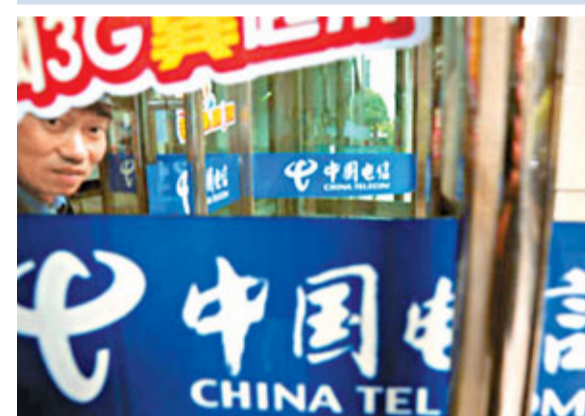
■中國電信涉壟斷一案有望和解。