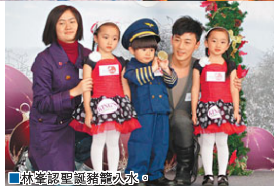
■林峯認聖誕豬籠入水。

JPM事後接受訪問，王子表示已很久沒來香港，見到Fans非常開心及很high，說到他們與女Fans有身體接觸，但毛弟卻不敢咀女Fans，毛弟笑道：「我也親視下那個很熟的女Fans，如果老闆OK，我無問題。」至於王子也表示想與女Fans咀咀，他笑言：「如果真的我也可以，我拍過很多親熱戲，很熟練，最緊要可借位。」小傑更說：「如果可以令我high，我可以百分百錫下去。」小傑被問到剛才捉住女Fans手教跳舞時，疑似觸及對方胸部？他立即否認有這回事：「沒有碰到，角度問題。」問到可有遇過瘋狂Fans？王子坦言試過一次被一名女Fans