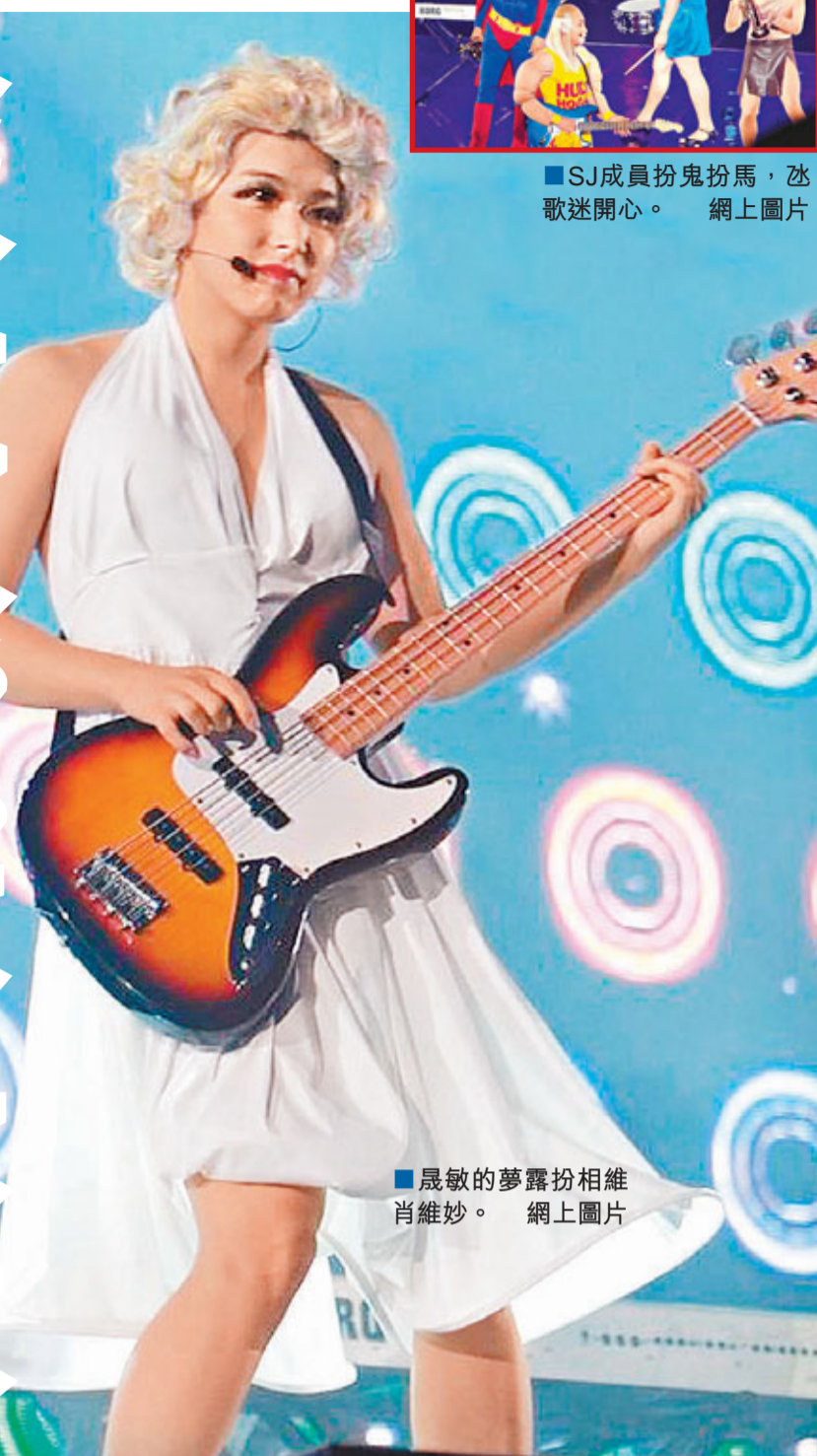
■晟敏的夢露扮相維肖維妙。