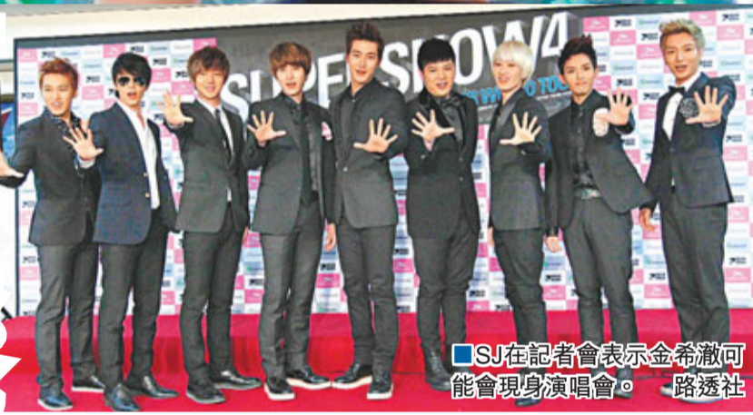
■SJ在記者會表示金希澈可能會現身演唱會。