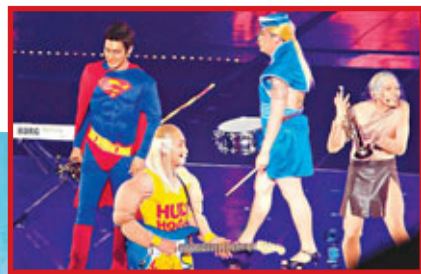
■SJ成員扮鬼扮馬，令歌迷開心。