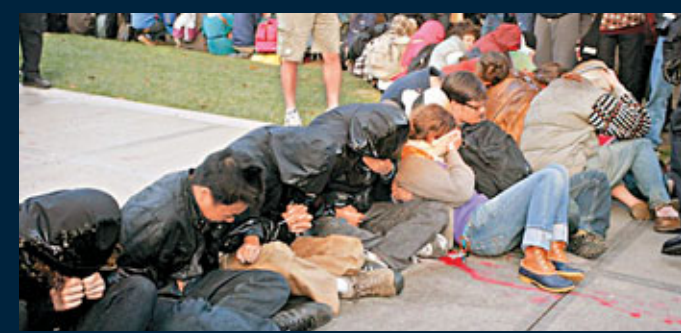
學生的臉被染成橙色。