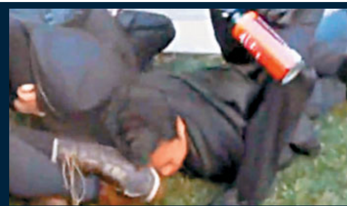
有人被按在地上,近距離「食椒」。

合共4頁的備忘錄信紙頂端印上華盛頓知名游說團體Clark Lytle Geduldig & Cranford(CLGC),內容提議客戶ABA對「佔領」行動及其支持者展開60天的「敵對調查」,分析行動資金來源,調查組織者背景,讓華爾街企業準備就緒,利用相應的媒體活動,編造示威者及支持他們政客的「負面敘述」。CLGC警告,示威行動會削弱民主共和兩黨對華爾街的支持,並表明來年大選的結果會對金融業產生重大影響。CLGC指,奧巴馬連任成功並非最大威脅,共和黨也「跳船」不再偏袒華爾街,才是銀行業的大災難。 路透社/美國全國廣播公司/《每日郵報》