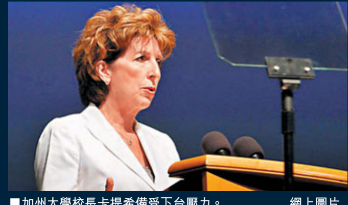
加州大學校長卡提希備受下台壓力。