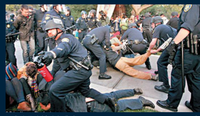
幾名學生被強行帶走。