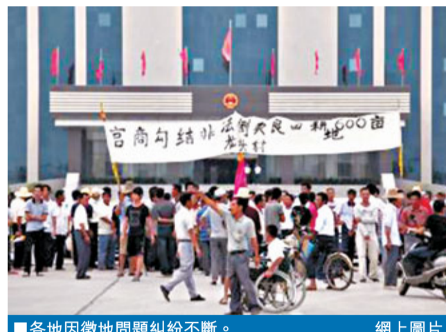
各地因徵地問題糾紛不斷。網上圖片

香港文匯報訊（記者 江鑫嫻 北京報導）國土部副部長王世元19日表示，國土部門將鼓勵有條件的地方進行農村土地股份制改革。他稱，要實行最嚴格的耕地保護和節約用地制度，促進城鄉統籌發展。有專家表示，此舉有助於解決農民進城務工、耕地荒廢的情況，亦是維護農民權益的政策趨勢。