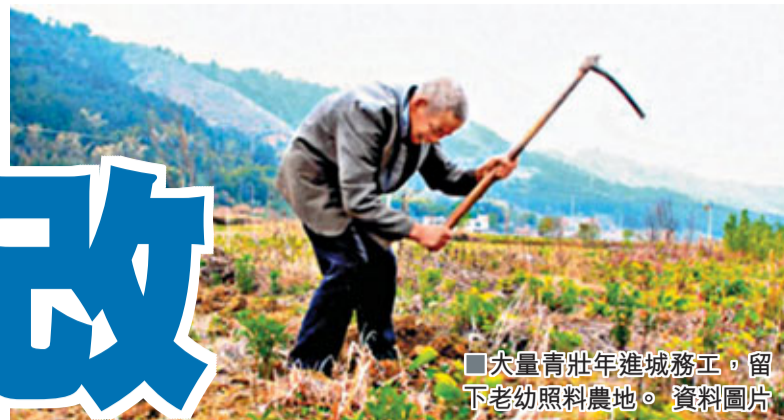
大量青壯年進城務工，留下老幼照料農地。資料圖片

香港文匯報訊（記者 江鑫嫻 北京報導）國土部副部長王世元19日表示，國土部門將鼓勵有條件的地方進行農村土地股份制改革。他稱，要實行最嚴格的耕地保護和節約用地制度，促進城鄉統籌發展。有專家表示，此舉有助於解決農民進城務工、耕地荒廢的情況，亦是維護農民權益的政策趨勢。