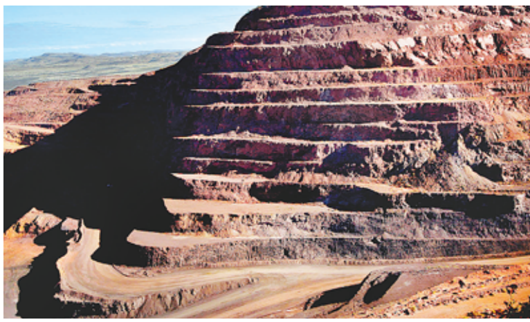
有色資源按步成為利海集團未來重要的發展板塊。

買入3億股萬佳錫業，開始實施其佈局資源領域的計劃。同時，利海團隊對內蒙古等內地礦產資源開發進行深入調查，未來可能有通過萬佳錫業具備擴展更多種類礦產資源的戰略意圖。