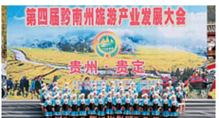
第四屆黔南州旅遊產業發展大會開幕式上，布依族歌演唱表演。

香港文匯報訊(記者 虎靜 貴定報導)第四屆黔南旅遊產業發展大會暨中國、貴定鄉村旅遊文化節日前在貴定縣盤江鎮音樂「金海雪山」景區開幕，今屆大會主題為「金海雪山美·布依風情濃」。在當天舉行的招商引資推介會上，香港眾鑫投資集團、北京高能控股、上海山悠製衣等15家企業與黔南州簽約15個項目，累計總投資19.2億元。