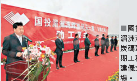
國投在湄洲灣煤炭碼頭一期工程開建儀式現場。

香港文匯報訊(記者 葉臻瑜 莆田報導)國家開發投資公司總投資22.1億元(人民幣，下同)的福建湄洲灣煤炭碼頭一期工程日前開建。據悉，該碼頭一期工程計劃2012年投用，建成後將成為福建最大煤炭碼頭。