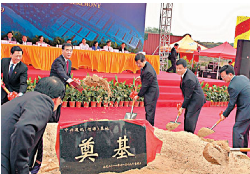
廣東省委書記汪洋(右四)等嘉賓為中興通訊河源基地鑄土奠基。

香港文匯報訊(記者 于濱 河源報道)廣東省委書記汪洋昨日見證廣東首塊硅基薄膜太陽能電池在廣東漢能基地下線,並為總投資100億元(人民幣,下同)的中興通訊河源基地項目揮鏟奠基。同期,投資100億元的東江商貿物流城和投資45億的東江·巴登城(DD莊園)項目分別奠基,加上一批戰略性新興產業項目簽約落戶廣東省河源,上述項目涉及投資總額突破650億元。