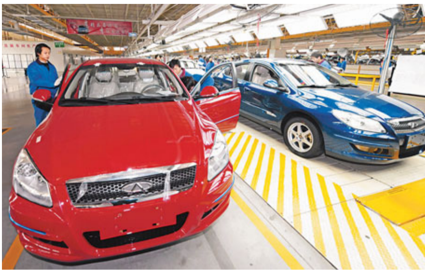
政府公務用車新的採購標準出台,有利自主品牌銷售。圖為奇瑞汽車總裝車間一瞥。

香港文匯報訊(記者 劉坤領 北京報道)為降低行政成本,推進節能減排,規範黨政機關公務用車採購管理,工業和信息化部、國務院機關事務管理局、中共中央直屬機關事務管理局日前聯合發佈《黨政機關公務用車選用車型目錄管理細則》(以下簡稱《細則》)。限制包括新能源轎車在內的一般公務用車和執法執勤用車發動機排氣量不超過1.8升,價格不超過18萬元。專家認為,中國政府公務用車新的採購標準出台,標誌着政府廉政進入新的階段。