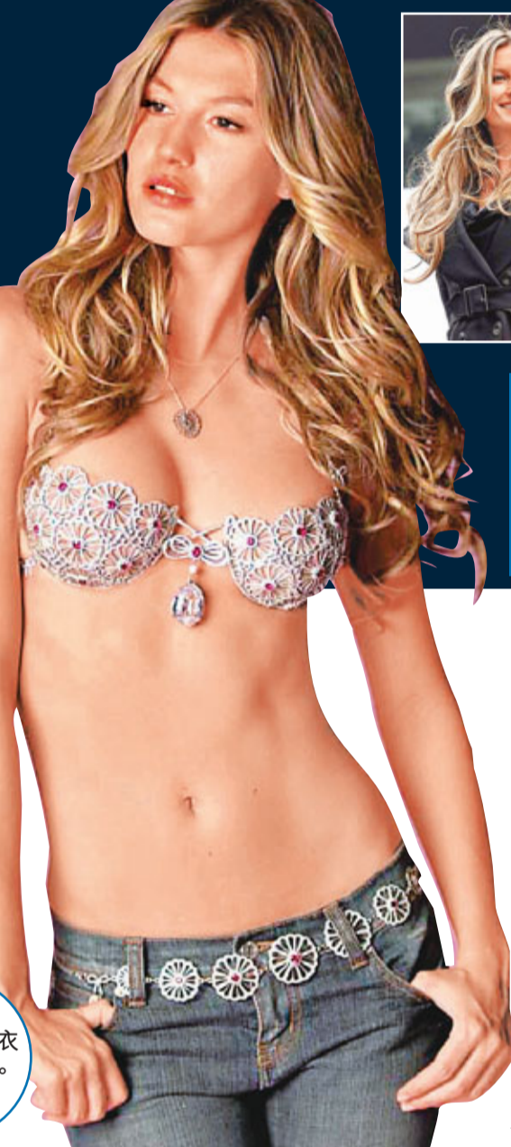
■Gisele 代言品牌一覽(部分)