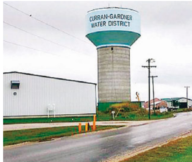
遭黑客入侵並破壞水泵的食水廠外觀。

美國伊利諾伊州一間食水廠上週遭黑客入侵破壞水泵，當局證實是來自俄羅斯的網絡襲擊，是美國首次有重要工業系統遭外國黑客入侵。雖然今次無造成嚴重影響，但由於美國很多公共設施，包括鐵路、水壩甚至核電站等都使用同類電腦系統，安全成疑。聯邦調查局(FBI)跟國土安全部已介入調查，據稱已追蹤到施襲的電腦是在俄羅斯。 食水廠位於伊州斯普林菲爾德，2,200名當地居民的供水未受影響。經調查後，當局確定施襲的電腦來自俄羅斯，暫時未知黑客動機。雖然網絡襲擊時有所聞，但以往黑客入侵個案主要涉及盜取資料或阻礙網