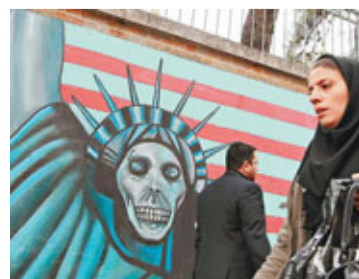
■德黑蘭一座建築外牆被人畫上反美圖案。

國際原子能機構(IAEA)理事會會議前日以大比數通過由伊朗核問題六方(即中、法、德、俄、英、美)共同提出的伊朗核問題決議。同一時間，聯合國大會亦通過決議要求伊朗就有關沙特駐美大使遭企圖暗殺一案協助調查。有華府官員形容，伊朗已面臨史無前例的國際孤立。