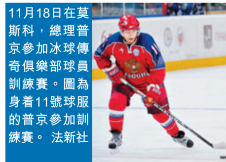
11月18日在莫斯科，總理普京參加冰球傳奇俱樂部球員訓練賽。圖為身著11號球衣的普京參加訓練賽。