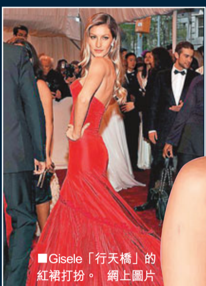
■Gisele「行天橋」的紅裙打扮。

巴西超級名模Gisele Bundchen「行天橋」行出富貴，去年勁賺4,500萬美元(約3.5億港元)，連續7年蟬聯全球賺錢最多的模特兒，但原來Gisele還有另一種影響力，就是與她合作的公司，股價能夠「跑贏大市」。自2007年至今，即使經歷金融危機等全球經濟風暴，她代言企業的股價整體急升41%，而同期道瓊斯工業平均指數卻跌4%，難怪各大名牌都甘心向這位「女財神」付上巨額代言費。