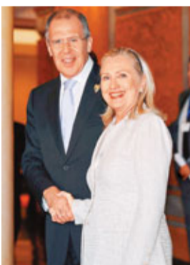
■希拉里(右)與俄羅斯外長拉夫羅夫在東盟會議上握手。