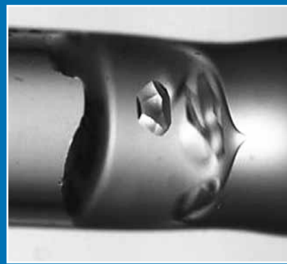
■神八上的雞蛋清酶在太空中形成結晶體。