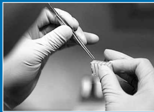
■中科院生物物理研究所的科學家正觀察剛剛從神八飛行艙取回的生物體。