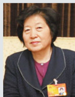
■福建省委書記孫春蘭。