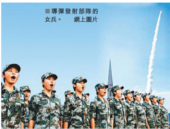
■導彈發射部隊的女兵。

據中新社18日電 中國軍隊首個「女子導彈發射連」18日正式組建，落戶「常規導彈第一旅」。這標誌着女子導彈發射單元正式進入二炮戰鬥部隊序列。據悉，「常規導彈第一旅」組建19年，連續12年保持全軍「軍事訓練一級單位」，兩次亮相天安門接受檢閱，榮立集體一等功1次、三等功4次，3次受到中央軍委通令嘉獎，是第二炮兵歷史上首個「百發百中旅」。「女子導彈發射連」由解放軍第一代女子導彈發射號手群體組建而來。2010年3月，某基地抽組35名女軍人成立導彈發射單元，先後兩次奔赴高原執行重大軍事任務，成功發射2枚導彈。