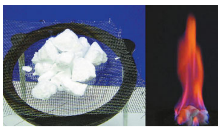
■可燃冰是新型清潔能源，中國儲量豐富。

香港文匯報訊(記者 沙飛 廣州報道) 據在廣州召開的全國「海洋地質、礦產資源與環境」學術研討會18日透露，中國對海域可燃冰的專項調查工作取得重大進展，目前在南海圈定了25個成礦區塊，控制資源量達到41億噸油當量，即相當於41億噸石油儲量。據廣州海洋地質調查局介紹，從2002年啟動的中國海域可燃冰資源調查與評價專項項目目前已取得一系列成果，2007年首次在神狐海域鑽獲可燃冰實物樣品，證明南海可燃冰資源遠景良好。近日，專項調查團隊已圈出南海北部7個遠景區，19個成礦區帶，僅神狐鑽探區內11個可燃冰礦體，面積就達到約23平方千米，氣體資源量約為194億立方米，控制資源量達到41億噸油當量。