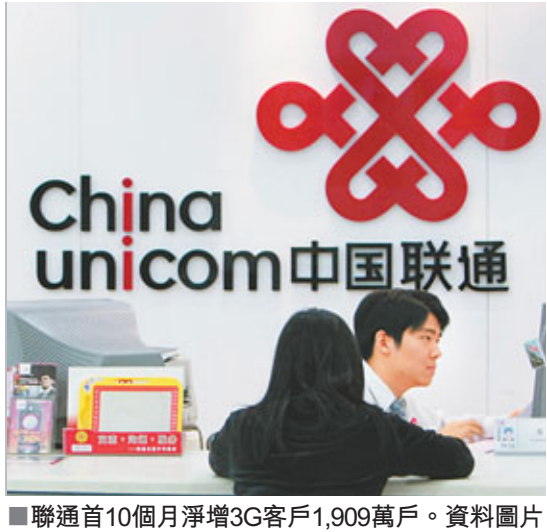
■聯通首10個月淨增3G客戶1,909萬戶。