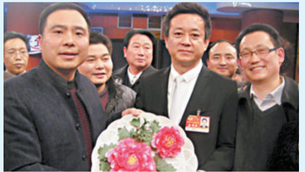
■牡丹瓷創始人李學武(左一)把牡丹瓷贈送給中央電視台著名主持人朱軍(左二)。