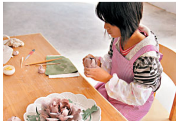
■技術工人在車間手工捏製牡丹花

2011年10月，由牡丹瓷創始人李學武主導的牡丹瓷博物館籌備專家論證會的召開，標誌着牡丹瓷創始人