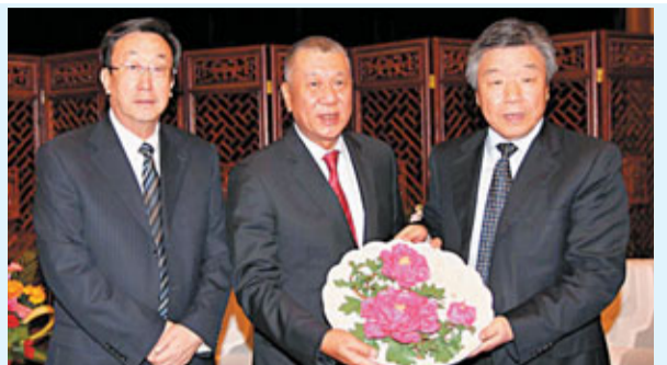
■中共河南省委書記盧展工(右一)、河南省人民政府省長郭庚茂(左一)把牡丹瓷贈送給全國政協副主席何厚鏞(中)。