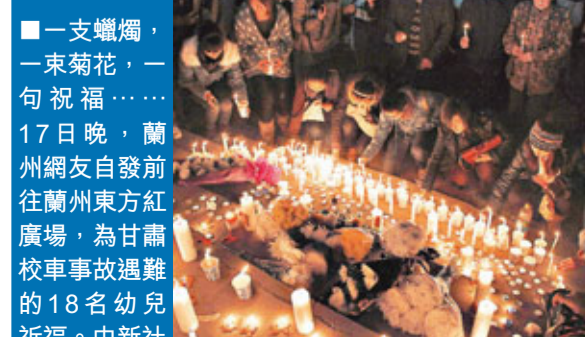
一支蠟燭，一束菊花，一句祝福……17日晚，蘭州網友自發前往蘭州東方紅廣場，為甘肅校車事故遇難的18名幼兒祈福。中新社

通報稱，目前，慶陽市幼兒教育普及程度低，民辦比例高、管理難度大，為解決民辦幼兒園教學和安全問題，大幅提高入園率，慶陽市18日決定，將投入7億元新建155所幼兒園，三年建成200所公辦幼兒園。