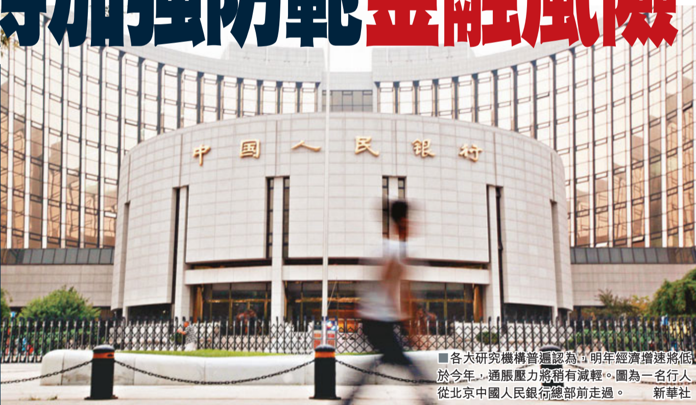
各大研究機構普遍認為，明年經濟增速將低於今年，通脹壓力將稍有減輕。圖為一行名從北京中國人民銀行總部前走過。

香港文匯報訊(記者 何凡北京報道)一年一度的中央經濟工作會議臨近，2012年的宏觀政策將見分曉。目前各大研究機構普遍認為，明年經濟增速將低於今年，通脹壓力將稍有減輕。據內地《21世紀經濟報導》稱，中國社科院經濟所宏觀分析課題組成員、宏觀室主任張曉晶近日指出，明年宏觀政策應以穩定為主，並在今年「穩增長、抑通脹、調結構」的三維，轉為「四維」，即加上「防範金融風險」內容。