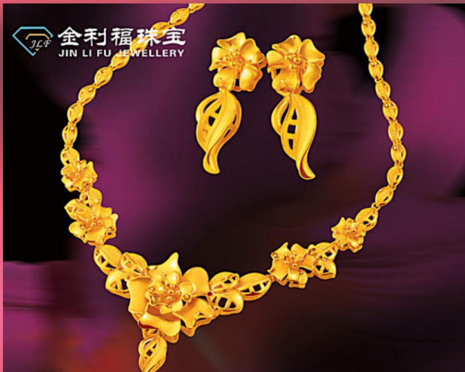
■金利福珠寶款式多樣，工藝精湛。

文化企業」評選。金利福珠寶有限公司。製造品牌的過程不斷豐富品牌的。明為新品代言；手冊》，在行業