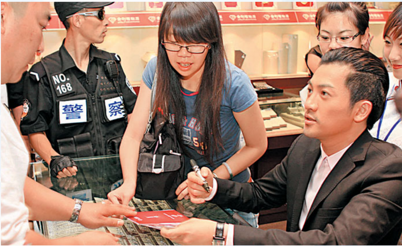
■明星蘇有朋參加金利福珠寶周年慶及簽售會

金利福珠寶公司，以短短10年時間迅速崛起，在全國擁有300多家專營店，成為中國十強珠寶品牌，堪稱商海奇跡。金利福更以「金品質、利天下、福萬家」品牌價值觀，成為中國首家珠寶「福文化」的傳播者。