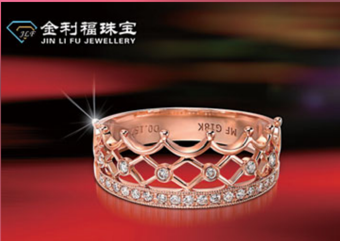
■金利福珠寶世界一流設計，引領中國珠寶時尚。