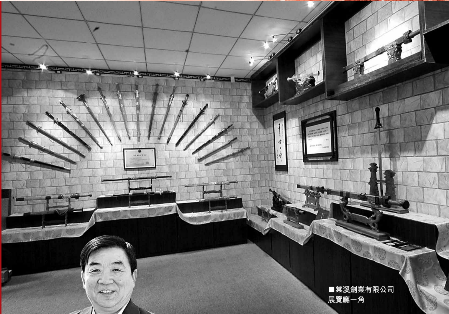
■棠溪劍業有限公司展覽廳一角