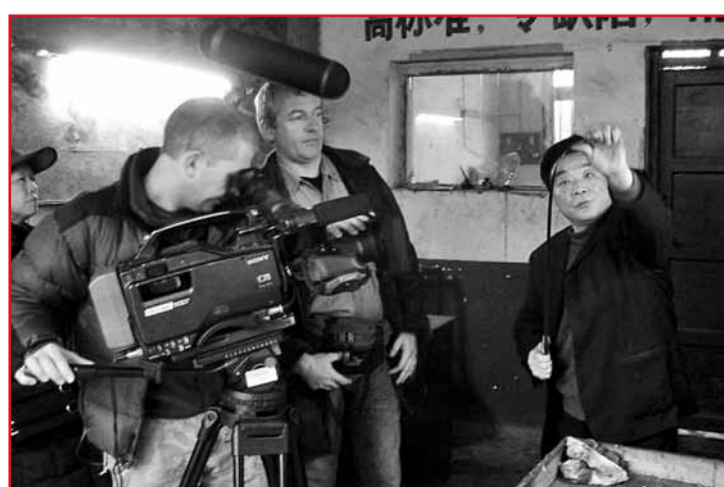
■德國電視台拍攝棠溪寶劍

創業者在研製開發新產品時，多以重大歷史事件為切入點。和平劍的劍條、劍架、底座構成一張形象的鐵甲，把古代化劍為犁的故事和人們嚮往永久和平的願望有機地結合起來，使人由犁想到了耕作，美麗的田園和安居的生活。天中劍的劍架是奔馬的造型，人們由奔馬想到駐馬店（古為傳送公文的驛站）進而想到崛起的天中象奔馳的駿馬奔向和諧、發展的未來。成功劍的劍架為萬里長城的造型，寓意眾志成城的13億人民托起成功的強國之夢。港澳回歸劍圍繞紀念香港、澳門回歸，表達愛國主義的主旨，分別使用了歷史四大發明，虎門銷煙，區徽紫荊花、蓮花等文化元素，並分別融入了1842、1997、1999長度、重量等技術參數，主題突出，個性鮮明。奧運劍以更高更快更強的理念和人類和諧相處的思想，使用了奧運會發祥地奧林匹亞、北京舉辦地的天壇、和平鐘、五環等文化元素。棠溪寶劍過硬的內在質量，獨特的創意、新穎的造型、豐富的文化內涵，精湛的手工藝，共同構建了完美的藝術品位。