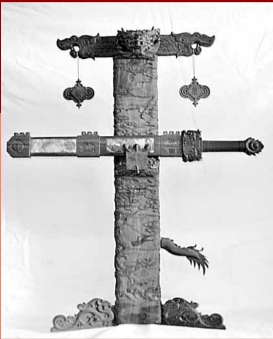
■紀念建國六十周年而設計的國威劍