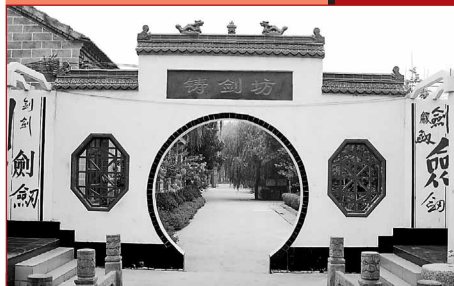
■棠溪劍業的鑄劍坊

軒轅乾坤劍復原了黃帝軒轅劍的威儀和風采，融黃帝文化與嫫祖文化於一體。劍條長99厘米，寓意天長地久和九九歸一，大小護手與劍柄的長度為33厘米，代表軒轅黃帝的生日。上面飾以騰飛的巨龍，代表黃帝；手柄上鑲嵌的56顆天然寶石，代表龍麟，寓意56個團結的民族；劍鞘飾以鳳，代表嫫祖。劍條厚3.6厘米，代表嫫祖的生日。劍條為龍舌，插入劍鞘，喻黃帝與嫫祖的親密結合。劍身由多種優質鋼經千錘百煉、反覆摺疊柔化、手工研磨而自然呈現的類似於「鈞窯窯變」的奇麗花紋。該劍既可斷鐵，而不留任何鈍痕，又可削毛斷髮。該劍被國家權威專家鑒定會予以高度評價和肯定，專家們稱軒轅乾坤劍不失為當代藝術珍品，極具收藏價值和科學價值。此劍已被中國收藏家協會永久收藏。