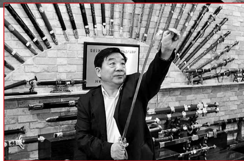
■高總展示可彎曲90度的輕型劍

位於歷史上九大名劍之首的棠溪寶劍具有2700多年的悠久歷史，河南省豫南的西平縣獨有的優勢資源鐵礦、淬刀劍特堅利的棠溪水、製作劍鞘的上佳材料棠木，奠定了成就「天下第一兵工重地」的物質基礎，資源優勢和高超工匠的技藝，共同演繹了春秋戰國時代棠溪寶劍的輝煌，被數十種歷史權威書籍所記載。西平棠溪劍業公司是一知名的科技文化型民營企業，國家質檢總局認定的原產地保護單位、河南省文化產業重點保護單位、中國冶鐵鑄劍研究基地、國家級工業旅遊示範點、中國優秀民營科技企業，全國中小企業創名牌重點企業。