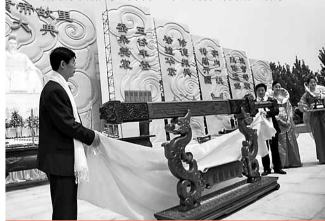
■棠溪劍業贈送黃帝拜祖大典的特質軒轅乾坤劍

國威劍是西平棠溪劍業公司為紀念建國60周年，以優質材料精心打造的珍品劍，融入的文化符號及技術參數、結構、造型等突出了國威、國魂的主旨。劍長60公分，大小護手龍飾19.49公分，暗含了建國60周年及誕生時間，劍鞘上的天安門、56個民族圖騰的圖飾，象徵中華民族大團結，劍盒上飾騰飛的龍，體現中華的崛起。劍盒立起來是劍架，又是抽象華表，劍懸其上，構成會義「天下平」三字，威嚴、大氣，十分具有視覺衝擊力。