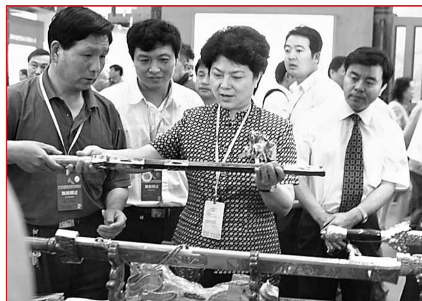
■河南省委常委、宣傳部長、副省長孔玉芳讚譽棠溪寶劍

西平棠溪鑄劍工藝自唐宋流徙民間後，為高氏歷代傳人所承傳，至第七代、八代傳人高西坤、高慶民，棠溪寶劍又重振雄風，他們既汲取了優秀的傳統工藝，又進一步探索總結了更居前沿的新工藝。二十世紀80—90年代，棠溪寶劍已恢復了古劍的強硬韌彈的特點，重型劍以一定的強硬度，其劍刃鐵劍刃不留任何鈍痕，輕型劍彎曲90度仍可恢復原狀，許多到棠溪寶劍廠購劍、賞劍的顧客或名人，對這一特點懷著驚奇的心理，拿起劍當場試驗，無不歎服，廠營銷室專一用作試驗的三角鐵和手指一樣粗細的鋼筋，留下許多次試驗的豁口和斷為