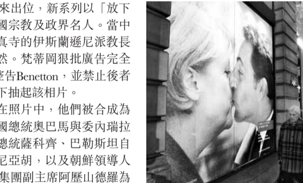
默克爾與薩科齊的「接吻」廣告照。

意大利服裝零售店Benetton的廣告向來出位，新系列以「放下仇恨」為題，利用電腦合成惡搞各國宗教及政界名人。當中教宗本篤十六世與埃及開羅阿茲哈清真寺的伊斯蘭遜尼派教長塔伊布「接吻」的照片，最令外界嘩然。梵蒂岡狠批廣告完全不能接受，昨日表示正採取法律行動控告Benetton，並禁止後者再發布該相片。Benetton前日終在壓力下抽起該相片。