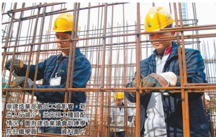
■建造業受最低工資影響，新血入行減少，並出現工種錯配情況。圖為建造業議會訓練學院扎鐵學員。