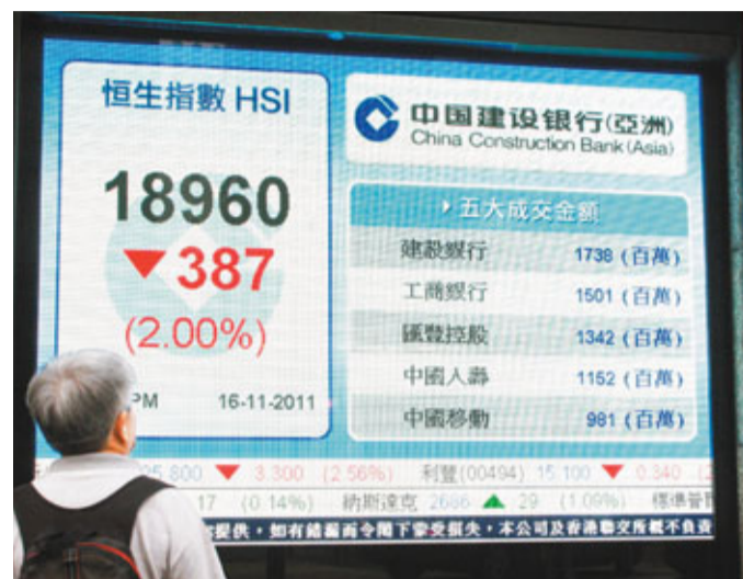
歐債危機仍困擾市場，港股先升後跌，一度下跌近600點，收挫387點，全日成交611億元。

油股下挫，中石化(386)跌2.77%、中石油(857)跌1.7%、中海油(883)跌2%。中航科工(2357)獲長實(001)主席李嘉誠增持，股價顯著上揚，全日抽升10.57%。綠森(094)母公司嘉漢林業反駁混水報告的指控，繼周二股價急升逾九成後，昨日再漲2.58%。