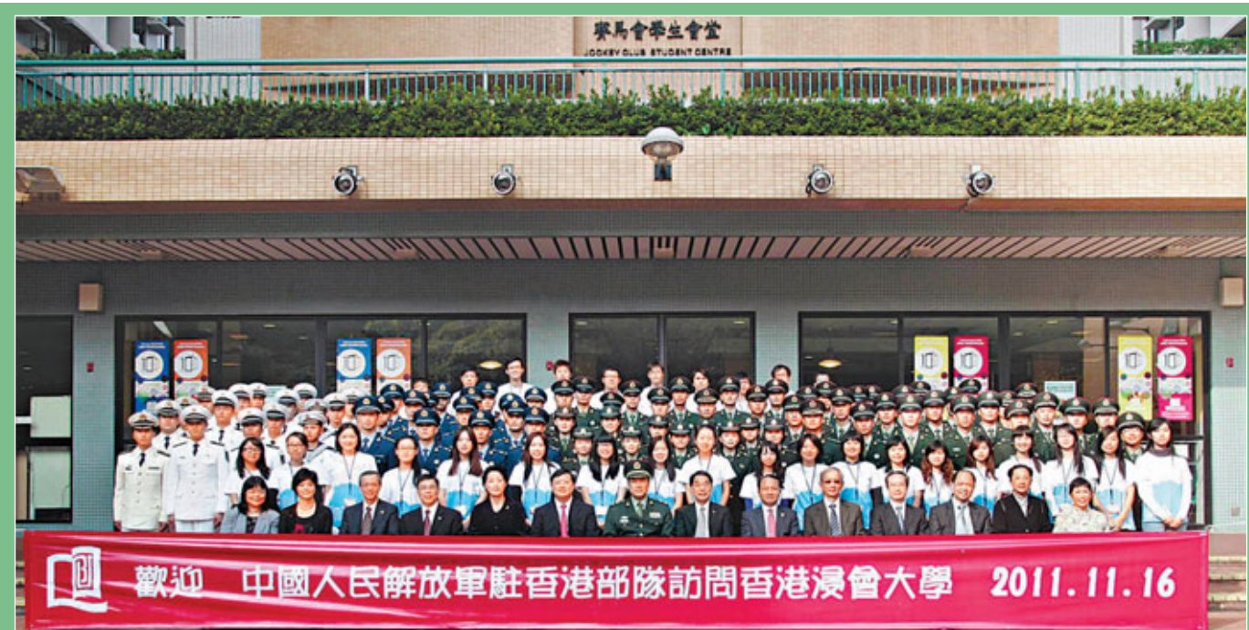
80名解放軍駐港部隊成員與到場迎接的浸大師生代表合照。