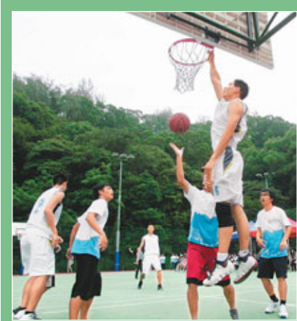
駐港部隊成員與浸大生展開籃球友誼比賽。