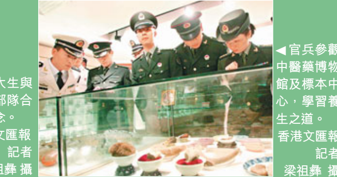
官兵參觀中醫藥博物館及標本中心,學習養生之道。

香港文匯報訊(記者 勞雅文)解放軍駐港部隊近年積極與本港市民交流,昨日又再「出動」走進大學校園與學生作近距離的交流接觸。約80名官兵應香港浸會大學邀請,昨到訪參觀該校特色課程及設施,包括傳理視藝大樓、中醫藥博物館、標本中心及圖書館等,又與學生共進午餐及切磋球技,體驗校園生活。多名浸大學生與解放軍交流後,都盛讚官兵態度親切「有問必答」,讓他們可了解軍營內的「神秘」生活,一改原本心目中以為官兵都是不苟言笑的嚴肅印象。