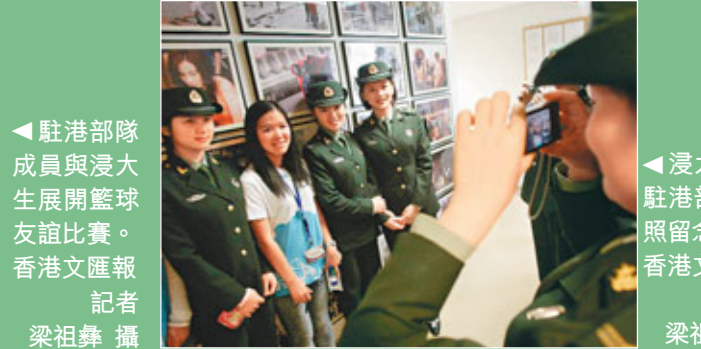
浸大生與駐港部隊合照留念。