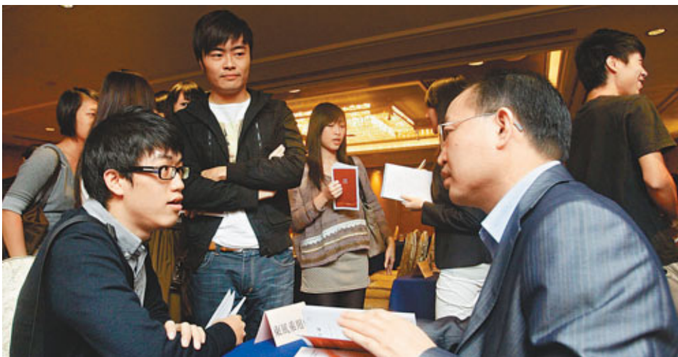
昨日的懇談會共吸引到35名準畢業生到場,了解武漢的工作條件。香港文匯報記者 劉國權攝

香港文匯報訊(記者 歐陽文倩)為吸納具國際視野的港校畢業生,推動自身發展,9間來自不同界別的武漢知名企業昨日聯合來港舉行人才招聘會,提供年薪由5萬元至20萬元人民幣的職位,希望招聘500名專才。武漢企業更特別對港生提供不少福利,除薪金及安排住宿外,更有企業表示會為員工儲起「買樓基金」,讓有意在當地長遠發展的港生不愁住房問題。也有企業稱可以提供「彈性工作地點」,公司會與申請人商量盡量配合,如果人才夠優秀,更可以為其在港增設項目或公司,歡迎港生向他們提交建議書。